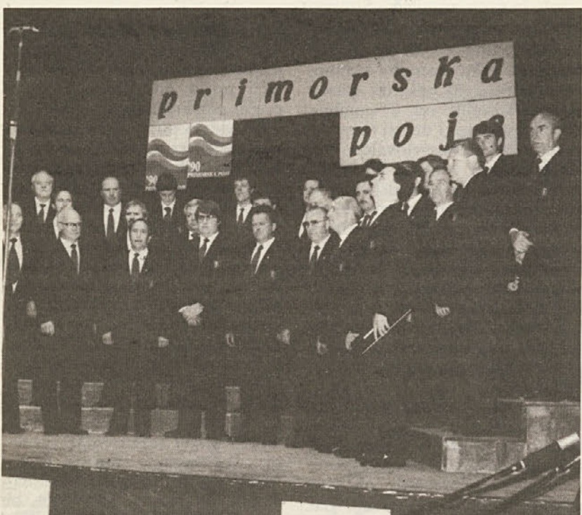
■ Kulturno društvo Tabor je v nedeljo 1. aprila priredilo v Prosvetnem domu na Opčinah koncert v okviru zdorovske revije Primorska poje. Na posnetku zbor KD »F.Venturini« z Domja.

V znamenju določenega optimizma se torej pripravljamo na bližnjo volilno preizkušnjo. Prepričani smo, da smo v mejah možnosti storili precejšnje korake naprej. Istočasno pa imamo še veliko novih idej in predlogov za prihodnje petletje s prvenstveno željo, da bi tudi vnaprej delali zato, da bi se vsak občan mlad ali starejši, Slovenec ali Italijan, moški ali ženska, v svoji občini dobro počutil. To je bilo in mora biti tudi v bodoče osnovno vodilo uprave, ki hoče biti levičarska tudi po vsebini in mora zato dati pozitivne odgovore izzivom današnjega časa.