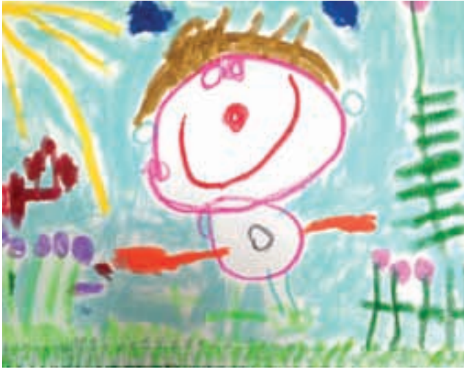
Ula, 4 leta