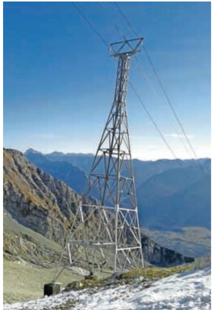
Obnova Kanina

"Na Fakulteti za strojništvo sem redni profesor in vodja laboratorija za konstruiranje LECAD. V sklopu laboratorija je dvajset zaposlenih. Polovico sodelavcev je pedagoških pol raziskovalnih, torej na trgu. Delamo izjemne projekte: od fuzijskega reaktorja, programiranje na super računalnikih do srčne črpalke in inovacij, ki so praviloma patentirane."