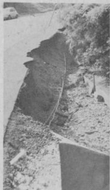
Unčeni del Kolodvorske ulice v Ormožu