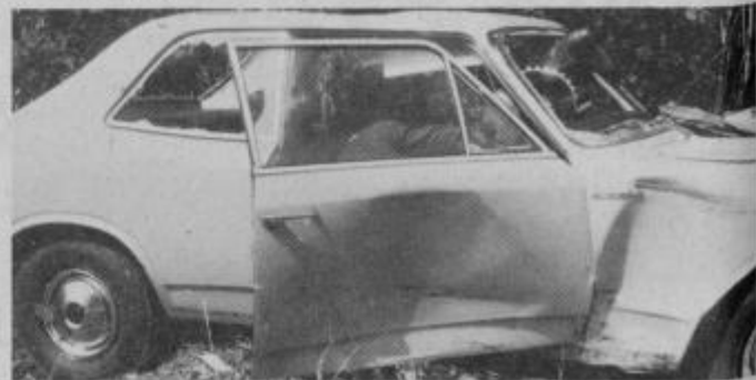
Poškodovano vozilo v njem pa ...

RIBI: Zareli boste zaradi slabe zmage in malo bledeli zaradi velikega dela. Sorodnica bo težka kot prijetna. Lepa vožnja velik nakup.