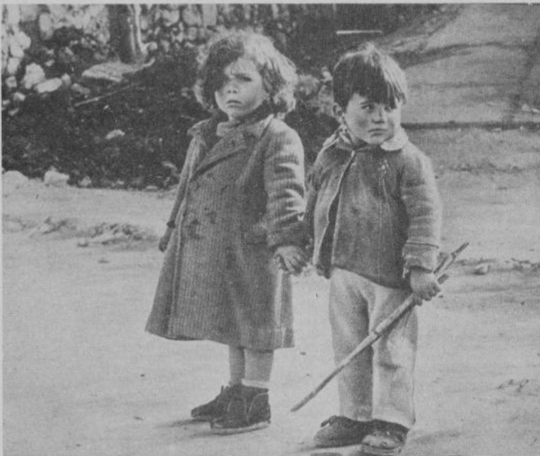
KOLIKO OTROK JE PREPUŠČENO ULICI, KER SO NJIHOVI STARŠI ODŠLI V TUJINO ZA BOLJŠIM KRUHOM? KAJ PA OTROCI ... KAM STA NAMENJENA NAŠA DVA?