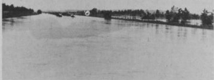
Namesto pogleda na umetniško formo vivo v Vidmu ob Ščavnici, vam predstavljamo Pesnico pri Vitomarcih, ki si je ustvarila kar dve strugi.