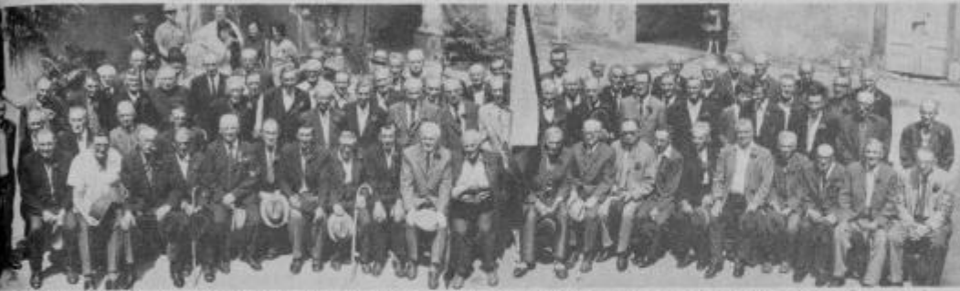
Ob končani slovesnosti ob prevzemu prapora smo naredili spominski posnetek še živečih borcev-prostovoljcev za severno mejo, ki živijo na področju občine Ormož.