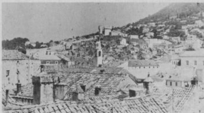
Dubrovnik iz ptičje perspektive.

Veliki smo pa tudi čisto zaresno prometno nesrečo, ki je na nas