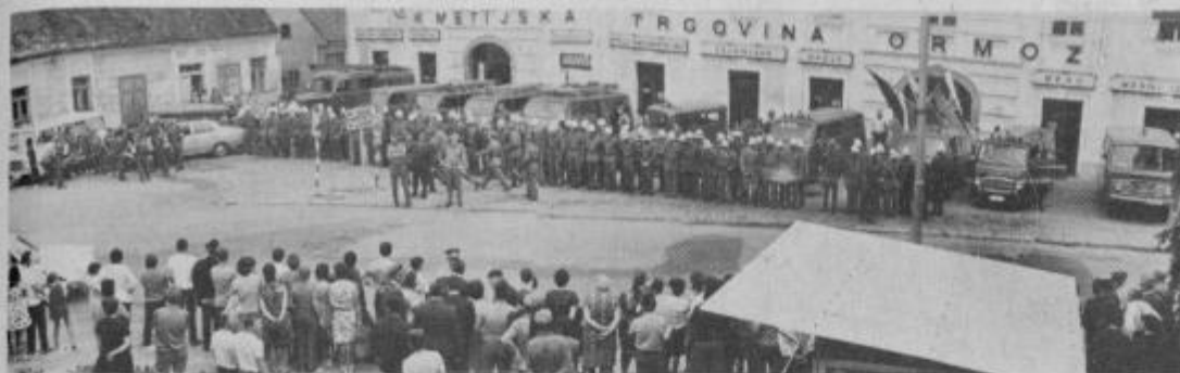
Na Mestnem trgu v Ormožu so se postrojili vsi „nastopajoči“ z vso svojo tehniko.

Dan vstaje Slovenskega naroda — 22. julij — so si gasilska društva s področja gasilske zveze občine Ormož izbrala za svoj gasilski dan. Minulo soboto so zato bile v Ormožu velike gasilske vaje in druge svečanosti.