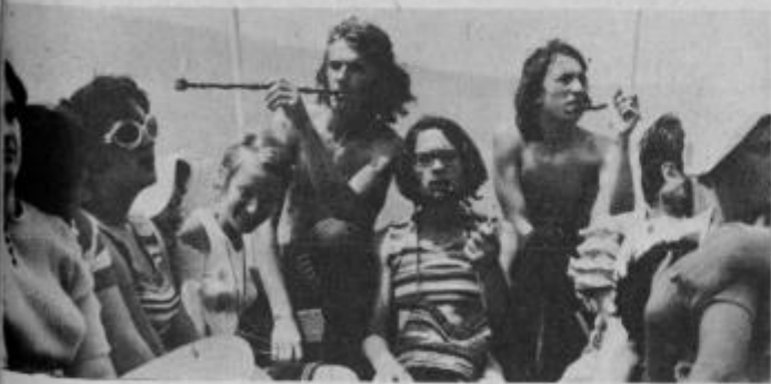
Na vožnji okrog Lokruma, so naši fantje prižgali pipe miru kot nepozaben spomin na sarajevsko Baš čaršijo.

ko sta se vrnila naša vodiča. Povedala sta nam, da bomo spali v privatnih sobah. Po nas so prišli domačini in nas odpeljali na svoje domove. Ker je letos bolj malo turistov, so se skoraj stegli pa to, kdo nas bo dobil več „pod streho“. Kar radovedni smo bili, kako bodo izgledala prenočišča in po tihem smo upali, da se bomo lahko vsaj posteno umili, saj smo bili od dolge vožnje že presneto zdelani in potni. Naša želja se je uresničila, saj smo se znašli v zelo okusno opremljenih stanovanjih. Gospodinja, pri kateri