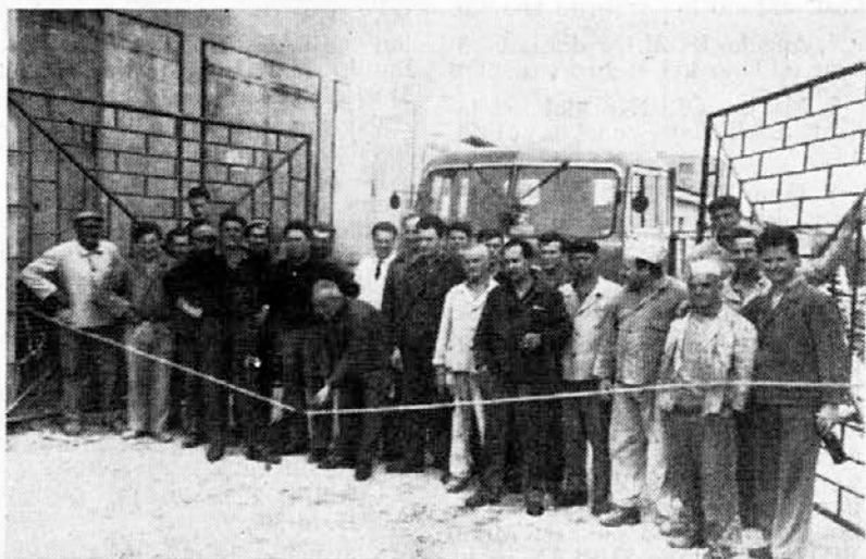
»Generalka« za otvoritev novega vhoda v obratu Iris

Z objavo te odločbe obveščamo vse člane kolektiva, kam naj se obračajo v vseh stanovanjskih zadevah.