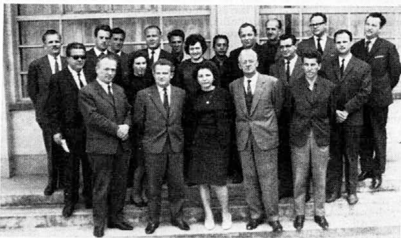
Novi in stari upravni odbor ob primopredaji samoupravljanja novemu upravnemu odboru

Kadrovske socialni sektor bo izdajal odločbe za dopust samo na podlagi tistih predlogov, ki so v skladu s temeljnim zakonom o delovnih razmerjih in s sklepom delavskega sveta.