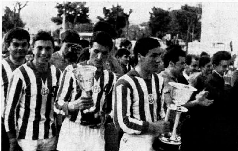
Izolski odbojkarji so osvojili kraški pokal na turnirju v Zgoniku pri Trstu. V finalnem srečanju so premagali tržaški »Bor« z rezultatom 3:0

Povratno srečanje veteranov bo v kratkem v Trstu.