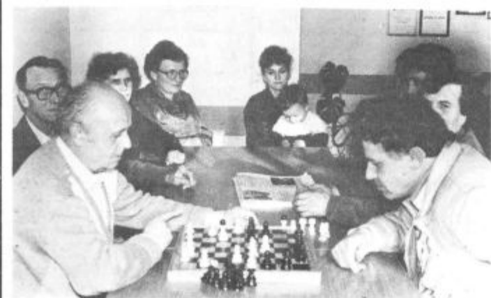
Vsako sredo se v tem prostoru zberejo slušno prizadeti

Ker krajevni Starega Velenja nimajo številne podrobnosti povezane z izgradnjo sistema, bo v ponedeljek, 4. aprila ob 17. uri, v Kulturnem domu v Šoštanjju, sestanek na katerem bodo strokovnjaki odgovarjali na postavljena vprašanja.