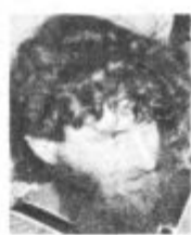
Piše: Vane GOŠNIK