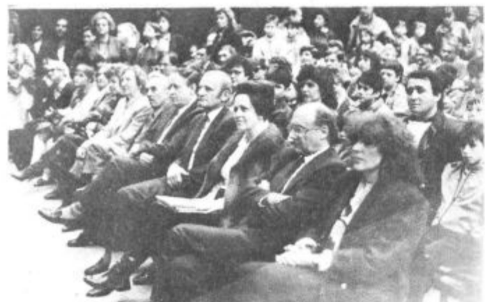
Dvorana je bila polna.