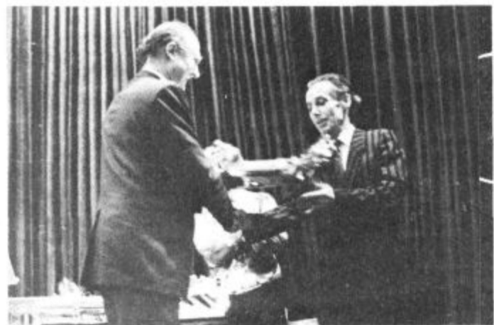
Darilo Pionirskega lista za Kajuhovo šolo.