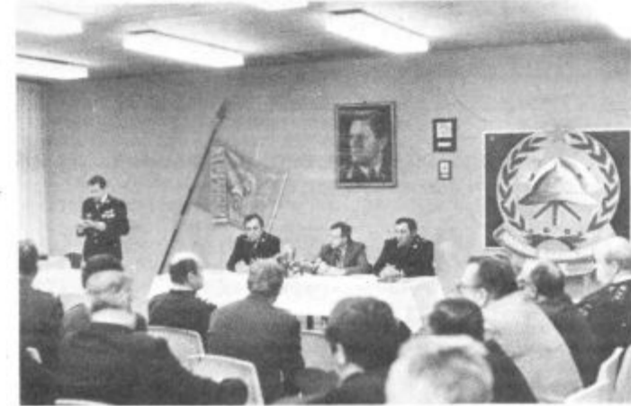
K usposobljenosti veliko prispevajo vaje, ki se jih udeležujejo tudi gasilci sosednjih občinskih zvez Ravne, Zalec in Titovo Velenje