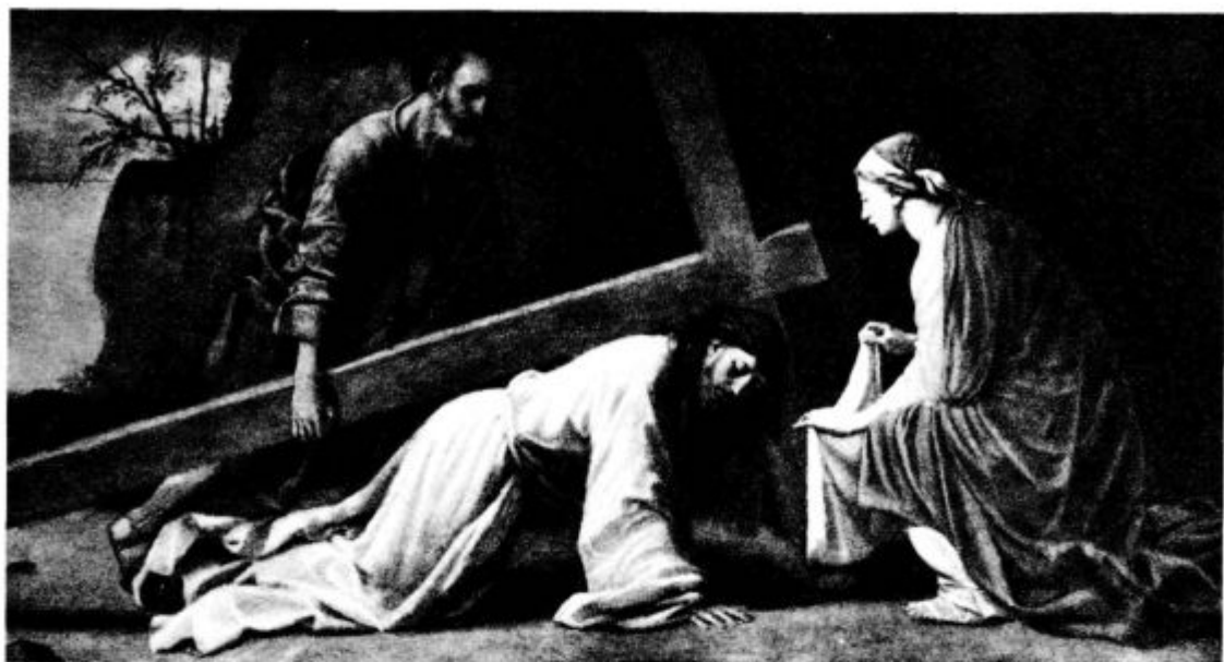
Veronika s prtom

v večnosti! Če je že treba križ nositi, ne nosimo ga kot levi razbojnik, ki je Kristusa — klel!