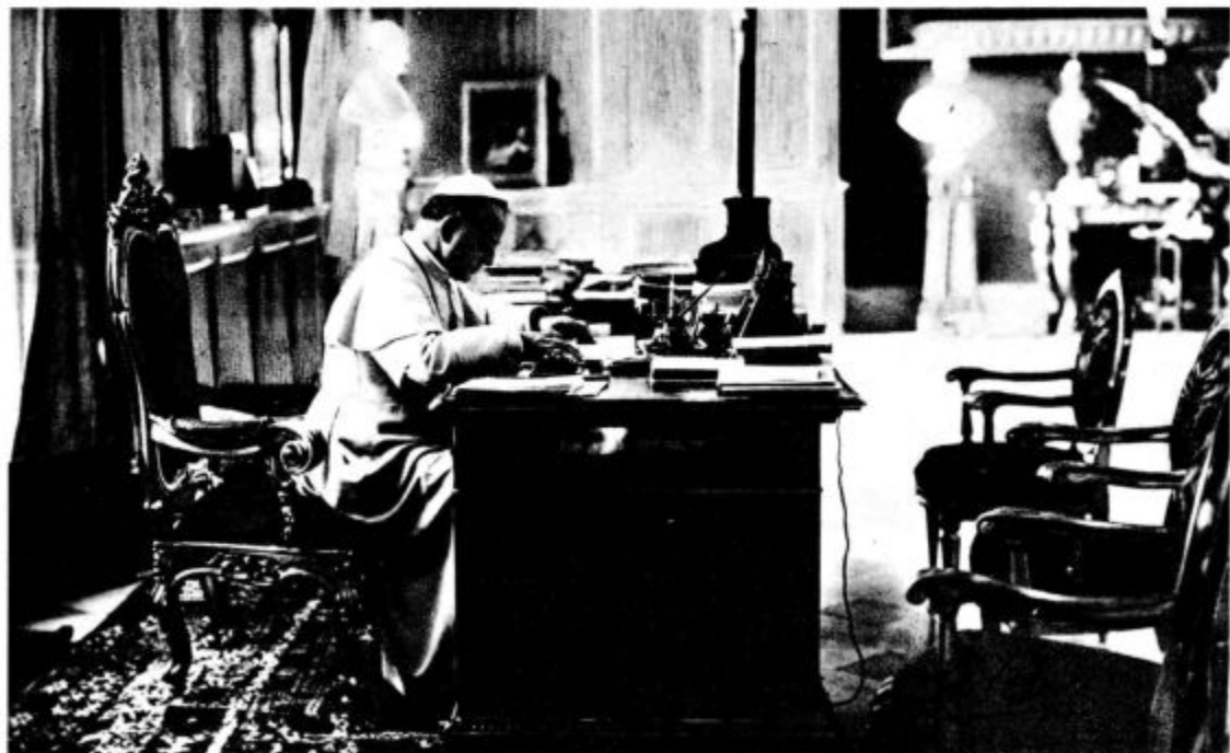
Sv. oče Pij XI. v svoji delovni sobi

V kakšne namene naj darujejo člani »Apostolstva bolnikov« svoje trpljenje in svoje molitve? V vse dobre namene, posebno pa tiste, ki jih priporoča sv. Cerkev vsak mesec, n. pr. za misijone, misijonske poklice, za zedinjenje