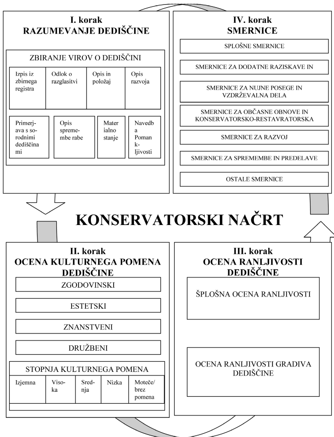
Slika 3. Shema konservatorskega načrta (povzeto po Restavratorski center 2007, 18).