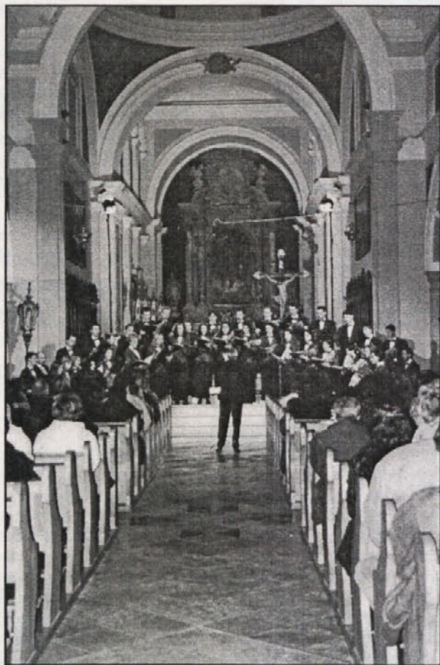
Il coro di Santa Giustina