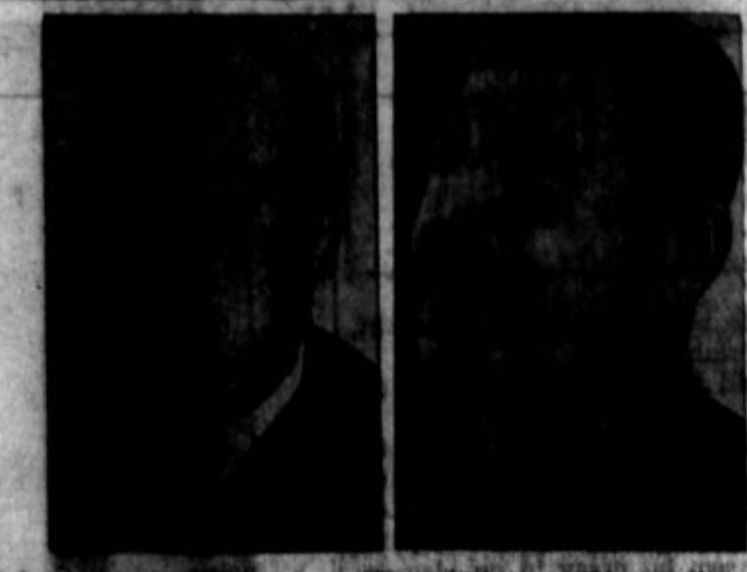
Angelski profesor Winston Churchhill in ruski premier Josef Stalin, ki sta nedavno konferirala v Moskvi o vojnih operacijah.

Ta program za pravilno prehrano je v glavnem usmerjen na domačo fronto, kjer se pripravljajo kosilo za delavce. Več kot 8.000.000 teh kosil za delavce se vsak dan pripravlja doma. Ve-