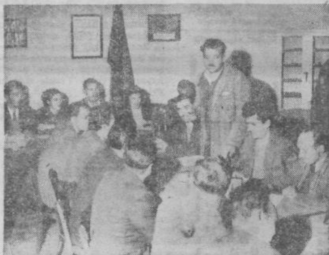
Delavski sveti že začinjajo razpravljati o planih za leto 1957

Posebno pozornost posvečajo znanstvenemu proučevanju delovne organizacije, s čimer se ukvarjajo skupine strokovnjakov. Potrebno pozornost posvečajo tudi znanstveni metodi izpopolnjevanja delovnih mest in njihovi vrednosti. N.O.