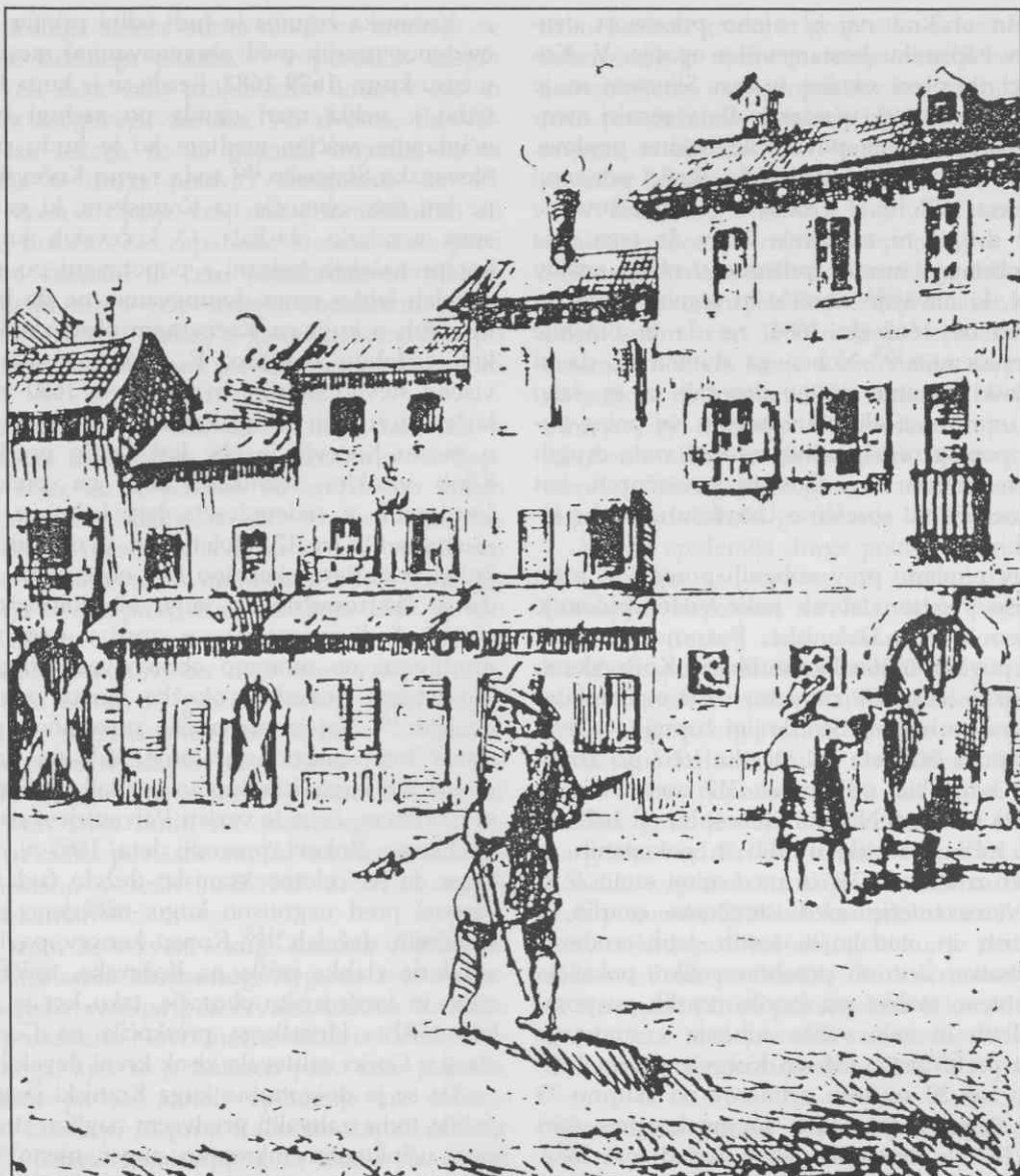
Označevanje okuženih hiš v Gorici

Na vrhuncu štajerske epidemije sredi leta 1681 si velja kot primer varnostnih ukrepov in njihovih kršitev ogledati utrinek iz življenja obmejnega Krškega, od vseh dolenskih mest življenjsko najbolj navezanega na zaledje onstran Save. Po kratkotrajnem odprtju kranjsko-štajerske meje aprila 1681 170 je z najvišjega mesta že konec junija prišel ukaz, da zaradi kuge pri Radgoni in v celjski četrti nihče s štajerske strani ne sme na Kranjsko, tudi če bi imel "fede", podložnikom pa so strogo prepovedali čolnariti po mejni reki Savi. 171 Malo zatem so bili v začetku julija na osmih kranjsko-štajerskih mejnih prehodih imenovani kužni ko-