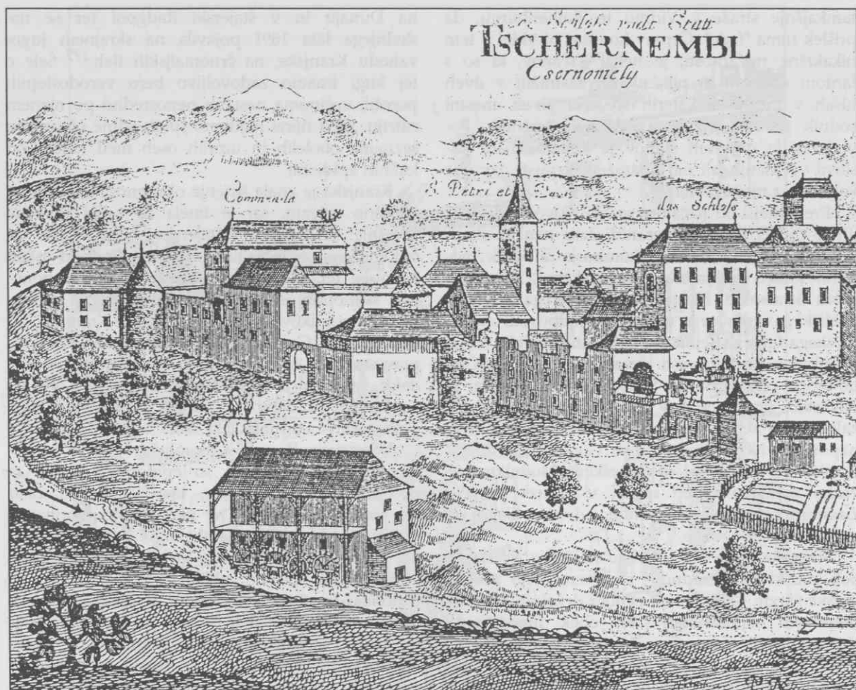
Črnomelj po Valvasorju desetletje pred kugo 1691; sredi mesta stoji župnijska cerkev sv. Petra in Pavla s pokopališčem, kjer so pokopavali kužne mrlice