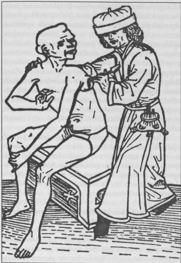
Kirurg inicira kužni bubon (lesorez iz rokopisa 1482)

Razpoložljive vire bi mogli glede na strukturo v grobem razdeliti na dve obdobji. Za prvo, ki sega do konca 16. stoletja, so značilna zelo redka in skopna sodobna poročila brez kvantificiranih navedb umrlih. Nekateri pojavi epidemije so znani sploh samo iz poznejših lapidarnih omemb, v pomoč pri sklepanju na potencialno število umrlih in posledično opustelost pa je moč pritegniti le ugotavljanje posestne (dis)kontinuitete v urbarjih in mestnih davčnih registrih. Drugo obdobje z začetkom ob zatonu 16. stoletja je nekoliko bogatejše s sumarnimi navedbami števila umrlih. Boljše so tudi možnosti preverjanja navedb s komparacijo nevtralnějšíh, povečini posrednih poročil. Šele konec 17. stoletja se pojavita nova prvovrstna vira - mrliške matične knjige ter sezname kužnih bolnikov in umrlih, vendar gre še vedno za precej redke pojave.