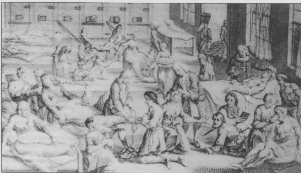
Bolnišnica za kužne (Besthof) v Hamburgu 1746. (Bakrotisk neznanega avtorja. Nemški narodni muzej Mürnberg)

nja leta ne predstavlja prevelikega povečanja; desetletno povprečje 1705-1714 znaša namreč 13,1. Upoštevati pa je seveda dejstvo, da je med 101 aninomno umrlo osebo tudi mesto prispevalo svoj delež, tako da je bilo lahko število umrlih mestnih prebivalcev bistveno višje. 235