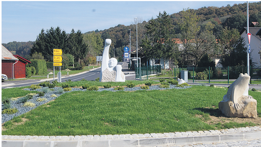
Ob prihodu v Juršince vas v krožišču v Gabrniku po novem pozdravijo skulptura boksarja in tri žabice.

Ideja o postavitvi doprsne skulpture boksarja z dvignjeno pestjo, ki je pravzaprav stara že nekaj let, je vzbudila kar nekaj pomislekov, a prav nobenega ni bilo na račun Dejana Zavca kot človeka, odličnega športnika in častnega občana, ampak predvsem na račun primernosti postavitve spomenika živemu človeku.