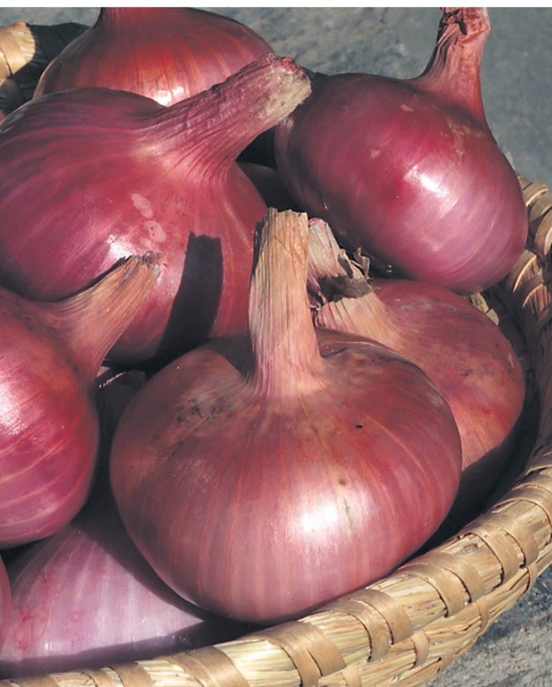
Foto: ptujski-luk.si uvozimo, le do 6.000 ton je pridelamo sami, od tega je zgolj 10 % ptujškega luka.

pridelujejo na tradicionalen način, brez strojev, samo z rokami, nato pa jo spletejo v doslej edina zelenjadnica v Sloveniji, ki se ponaša z evropsko shemo kakovosti ZGO. A za pet pridelovalcev skrivajo tudi resni izzivi. Višja cena zaradi butične pridelave, bitka za