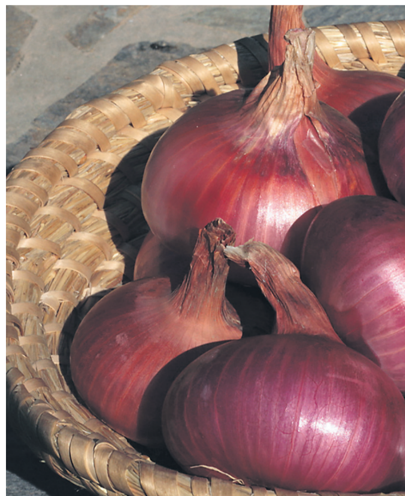
Slovenci porabimo približno 20.000 ton čebule na leto, od 13.000 do 15.000 ton je

Branko Majerič iz Moškanjcev, ki velja za očeta skupine, je bil kriti-