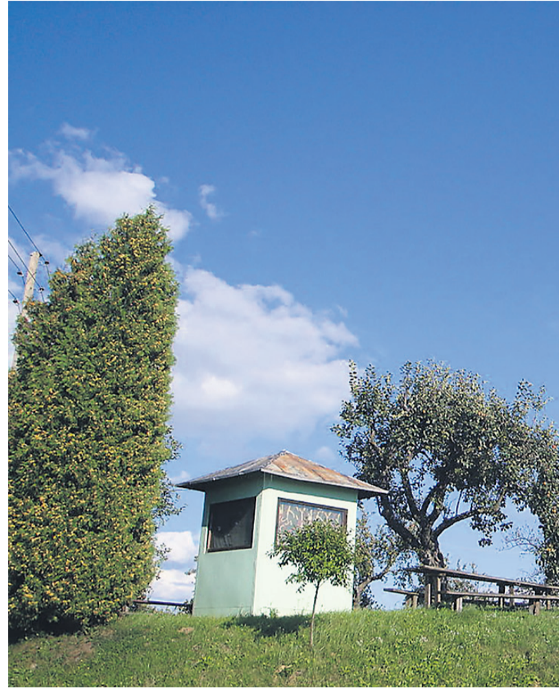
Je Senčak na meji med občino Sveti Tomaž in Juršinci naselje ali območje razpršene gradnje?

»Če izhajamo iz zakonodaje in območja razpršene poselitve, so to argumenti proti spremembi namenske rabe omenjenega zemljišča. Če pa gledamo z drugega zornega kota, s katerega je pogledalo ministrstvo za okolje in prostor, da je to območje naselje, pa je zadeva sprejemljiva. Se pravi, območje naselja se je razširilo z zadnje hiše preko celotnega območja, ki je namenjeno za turistično dejavnost, na Slanovo parcelo. Tako se spreminja celotni strateški del akta iz