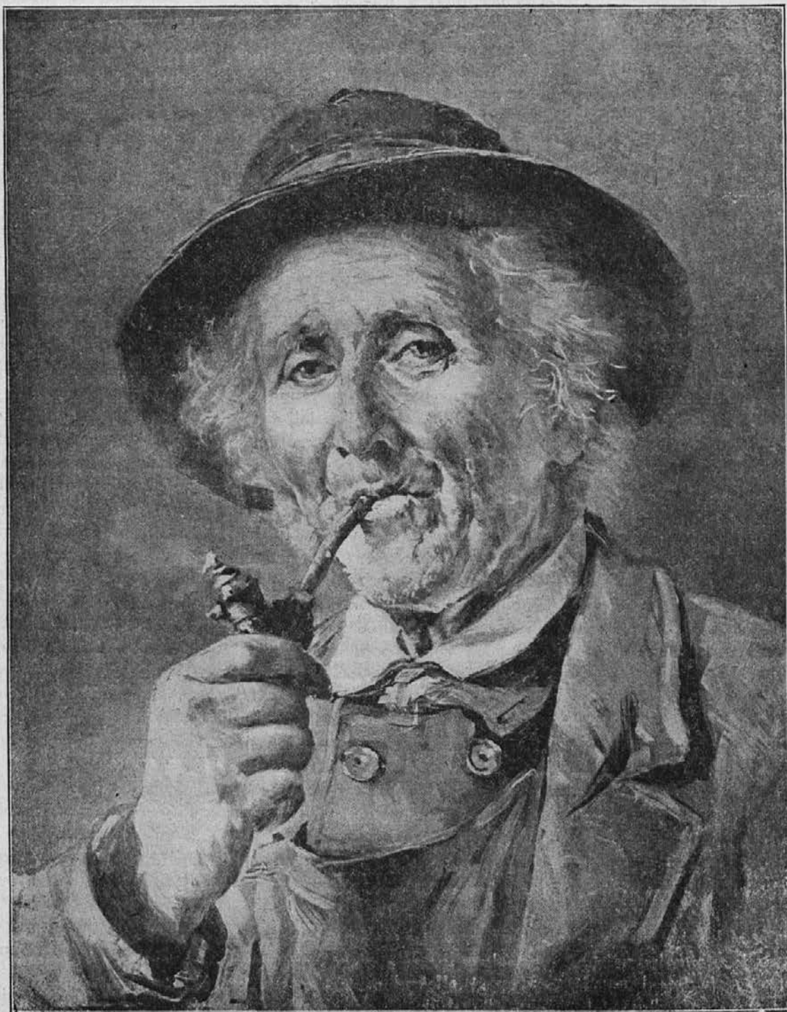
Naša stara korenina.

povzdigniti naše oči in dvigniti naše roke k Bogu, delitelju vseh dobrot. K Njemu se obračajmo, kajti brez Njega ni pravega veselja, ni prave sreče. On, on edini nam jo bo podelil, in presv. Mati Božja, Devica Marija, varuhinja družinske sreče, bo nad njo čuvala in jo pomnoževala!