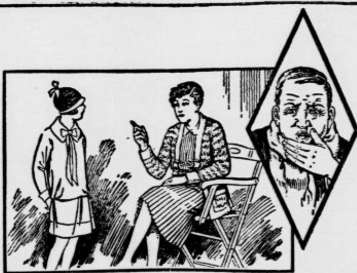
Mamica, ali naj še jemljem Kresival? — —

Ja, mo otrok, le vzemi, tatek kašlja in je hripav, in tudi nekaj Tvojih sošolk je prehlajenih.