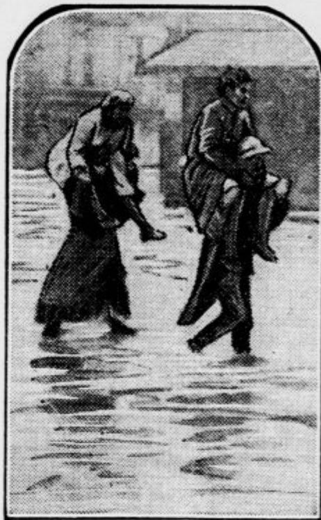
Senegalski črnici rešujejo ljudi

Kneževina Monako je imela doslej 90 mož veliko vojsko, ki jih je bilo za njene dosedanje potrebe čisto dovolj. Ampak v zadnjih časih je prišlo v državi opetovano do nemirov in tu se je pokazalo, da jim 90 mož velika armada ni kos. V bodoče bo menda zadostovala, ker so jo sedaj povečali za 45 mož.