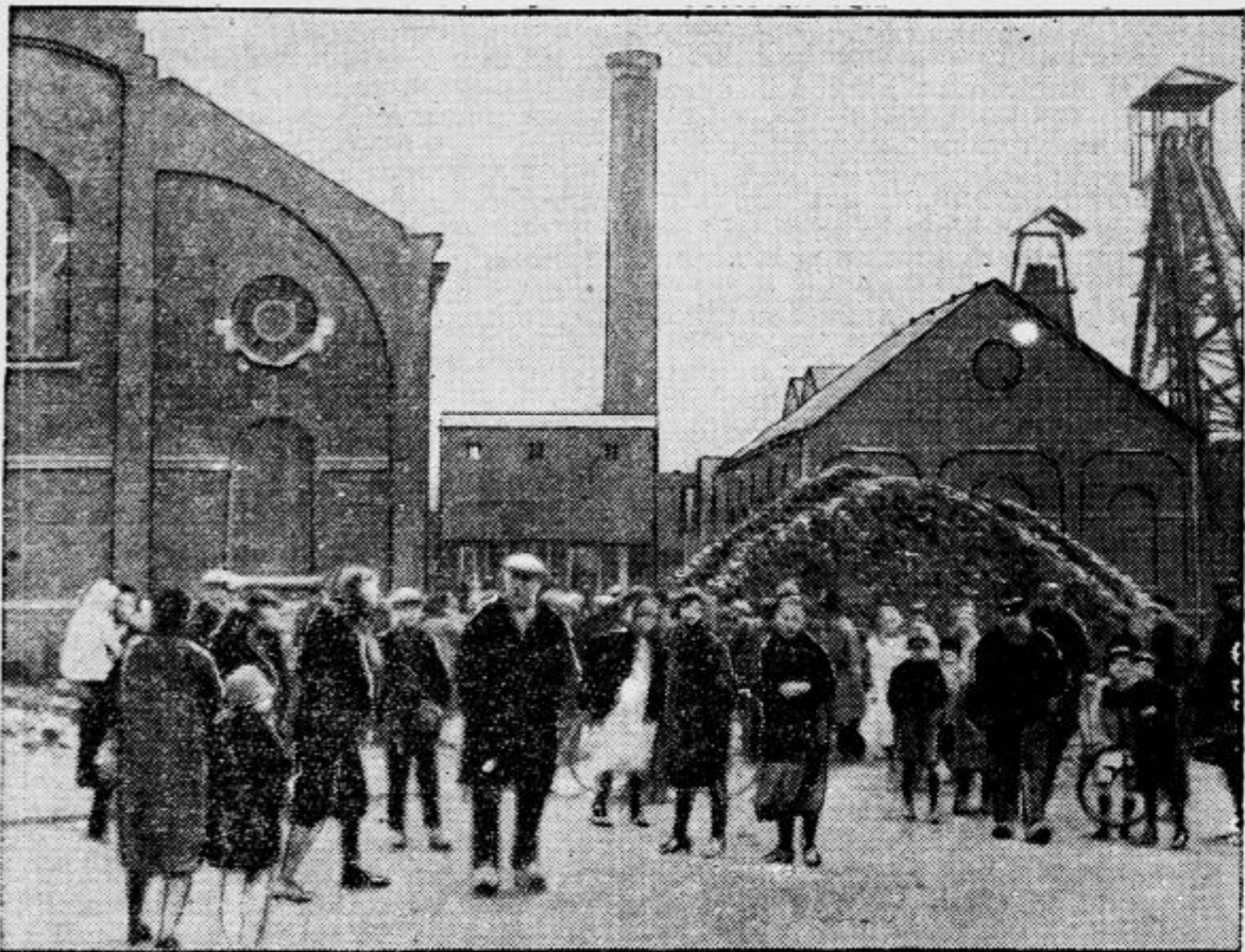
Rudniška nesreča v Macinellen

Svoji rudarjev strahoma pričakujejo vesti o rudarjih iz rova, kjer je prišlo do silne eksplozije jamskih plinov. Dvanajst rudarjev je bilo pri tem ubitih, mnogo pa težko ranjenih.