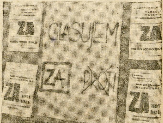
Glasujte za samoprispevek za šolstvo! Tako in drugače, povsod pa iznajdljivo, so bila v nedeljo okrašena naselja, posebno okolica volišč v radovljiški občini. Posnetek je iz Bohinjske Bistrice.