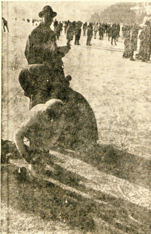
Mravljišče na ledeni ploskvi — Foto A. Triler