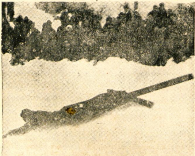
Na nedeljskih smučarskih skokih za pokal Kranja padci niso bili redki. Zaradi prekratkega izteka je tekmovanje na tej skakalnici precej nevarno.