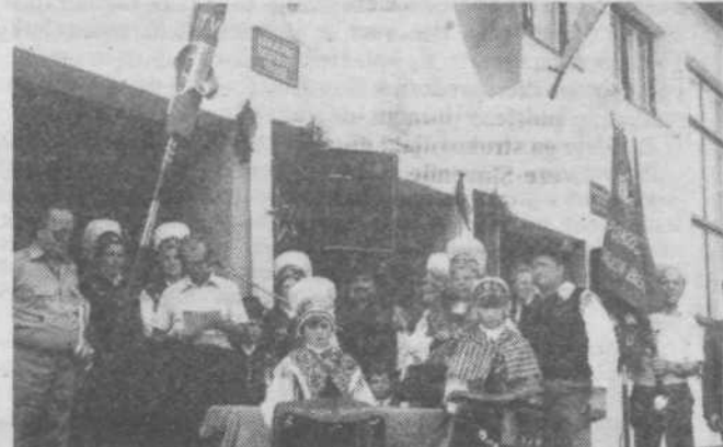
Pred slovesnim razvitjem novega prapora upokojencev v Dolskem