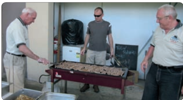
Odborniki kluba pripravljajo BBQ prigrizek.