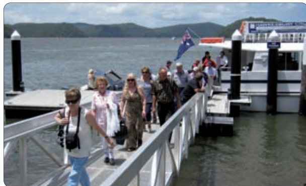
Z ladjo po reki Hawkesbury River.