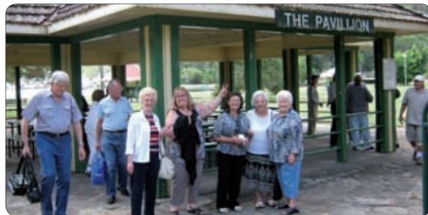
Paviljon v Bobbin Head.

V mesecu februarju pa se popeljemo z Zig Zag železnico v Blue Mountains.