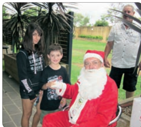
Dedek Mraz z darili za otroke.