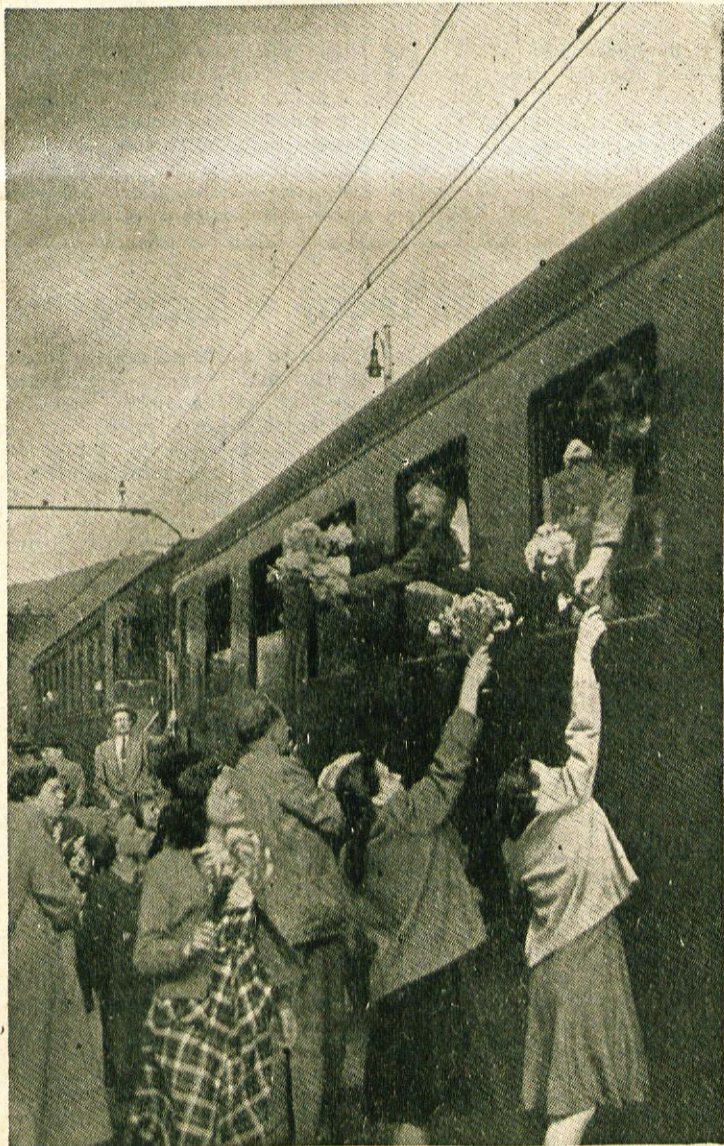
V petek, 18. t. m. so nas spet obiskali naši rojaki iz Amerike. Ogledali so si predilnico, razgledali z gradu, nato pa odšli po majhni zakuski na grobove talcev v Dragi. — Naša slika prikazuje sprejem ameriških Slovencev ob prestopu naše meje v Sežani.