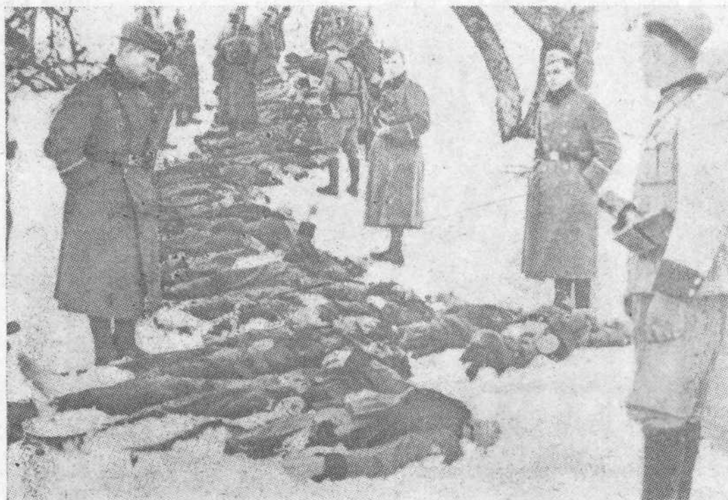
Cankarjev bataljon je 12. 12. 1941 v Rovtah na Gorenjskem uničil nemško policijsko patruljo 46 mož