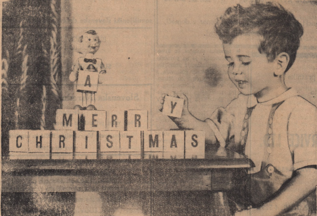
VESEL BOŽIČ VSEM, KI SO BLAGE VOLJE...