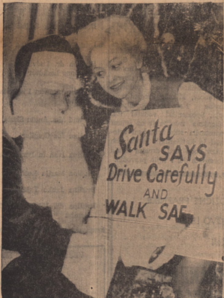
VOZI IN HODI PREVIDNO V DNEVIH, KI SE NAM BLIŽAJO...

DARUJE V TISKOVNI SKLAD "SLOVENSKE DRŽAVE"