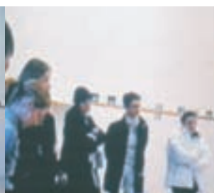
Slika 4: Študentska dela. Student's works.