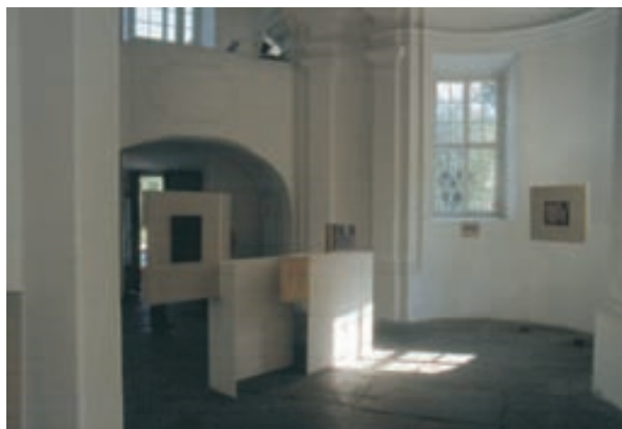
Slika 12: Simbolna postavitev zaslona - bariere, ki zaradi svoje višine ohranja pregled nad prostorom. Symbolic placement of the screen - barrier, whose height maintains surveillance over the space.