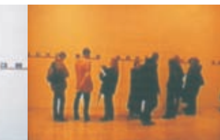
Slika 6: Niz. Series.