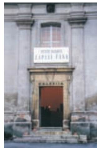
Slika 15: Vhod v posvečeni prostor umetnosti. Entrance to the sanctified artistic space.