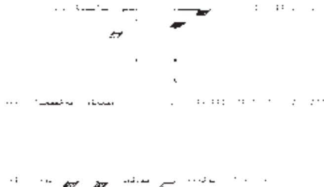
Slika 2: Shema postavitve razstave v Galeriji Akademije likovnih umjetnosti v Sarajevu. Scheme of the exhibition layout in the gallery of the Academy of fine arts in Sarajevo.

Akrilne slike, ki stoje na paravanu namesto običajnejših okvirjev, zaključujejo, oziroma zamejujejo "tankostenske" lesene škatle. Pokončna slika znotraj apside, ki zaključuje vzdolžno os, visi, odmaknjena od stene. S smeri vhoda gledano desna slika, stoji sredi apside na tleh, na nekakšnem stojalu, kar bi lahko v kontekstu postavitve asociiralo tudi na tabernakelj. Sliki v zlatosrebrnem okvirju gledata iznad parapeta.