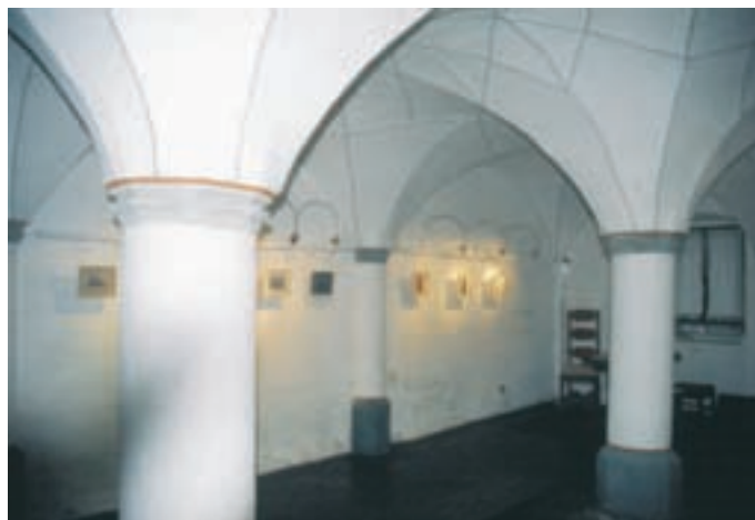
Slika 10: Miniature v prvi sobi. Miniatures in the first room.