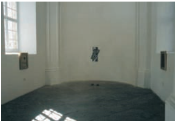
Slika 11: Galerija Krško; barvno najmočnejša slika na koncu vzdolžne osi. The gallery Krško; the painting with strongest colours is at the end of the longitudinal axis.