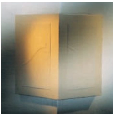
Slika 7: Vogalni grafiki. Corner graphics.