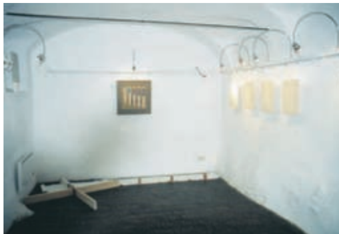
Slika 8: Galerija Šivčeva hiša; "Bele" grafike s slepimi odtisi in sence točk pod njimi. The gallery Šivčeva hiša; "White" graphics with blind imprints and shadows of points below them.