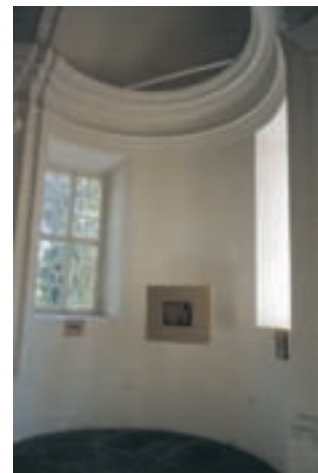
Slika 14: Prečna os - leva apsida. Traverse axis - the left apse.