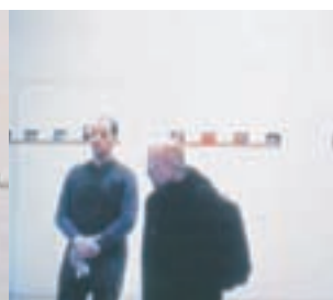
Slika 5: Ob odprtju. The opening.