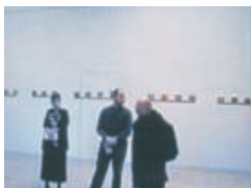
Slika 3: Niz. Series.