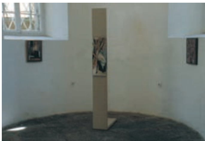
Slika 13: Postavitev v desni apsidi. Arrangement in the right apse.