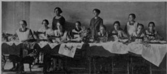
Šivalni tečaj v Šenčurju pri Kranju.

Egiptovska pošta je izdala pred par tedni samo za par ur nove znamke. Od vseh strani so prihrumeli takozvani filatelisti, nabiratelji poštnih znamk, da bi prišli do čim večje množine redkega papirja. Razvila se je med njimi pravcata vojska, v kateri je morala posredovati policija.