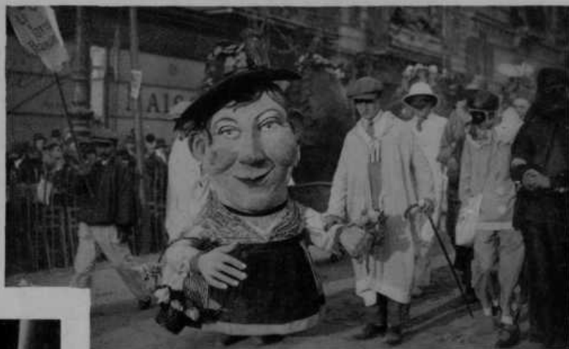
Pustni torek v Nici, glasovitem francoskem morskem letovišču.