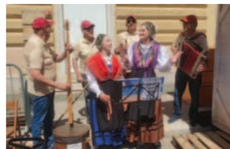
Članici FS s Kerglci izpod Ahca