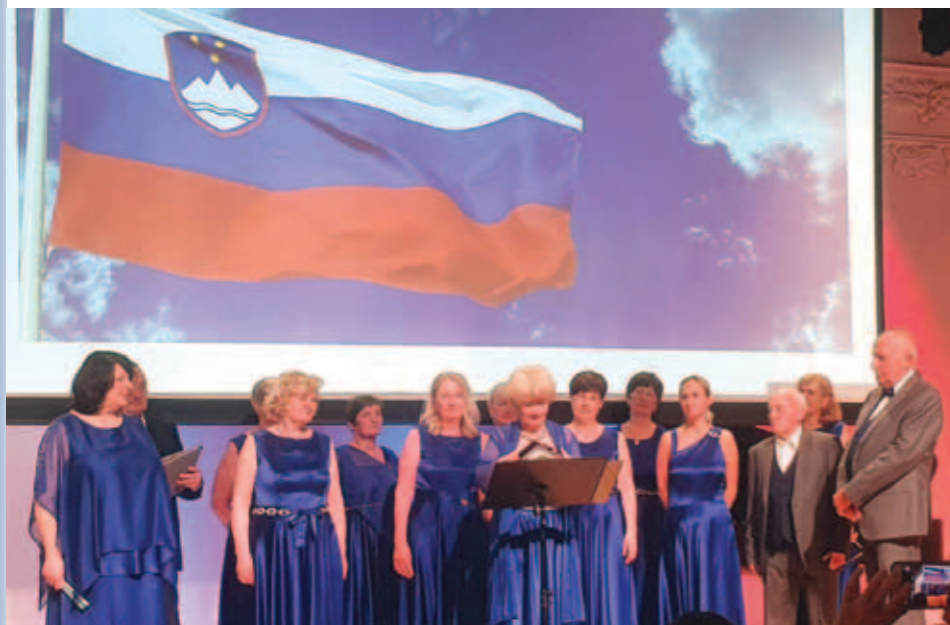
MePZ SKD Triglav, Split