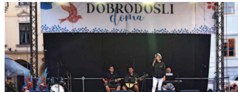
Z nastopa na novomeškem Glavnem trgu