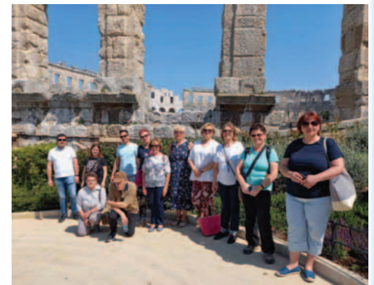
Spoznavanje zanimive dediščine Pulja