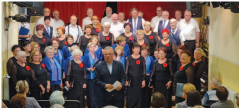
S skupnega nastopa obeh zborov

V dvorano KPD Bazovica se na veselje občinstva vračajo kulturni in glasbeni večeri, tudi z nastopi gostov.