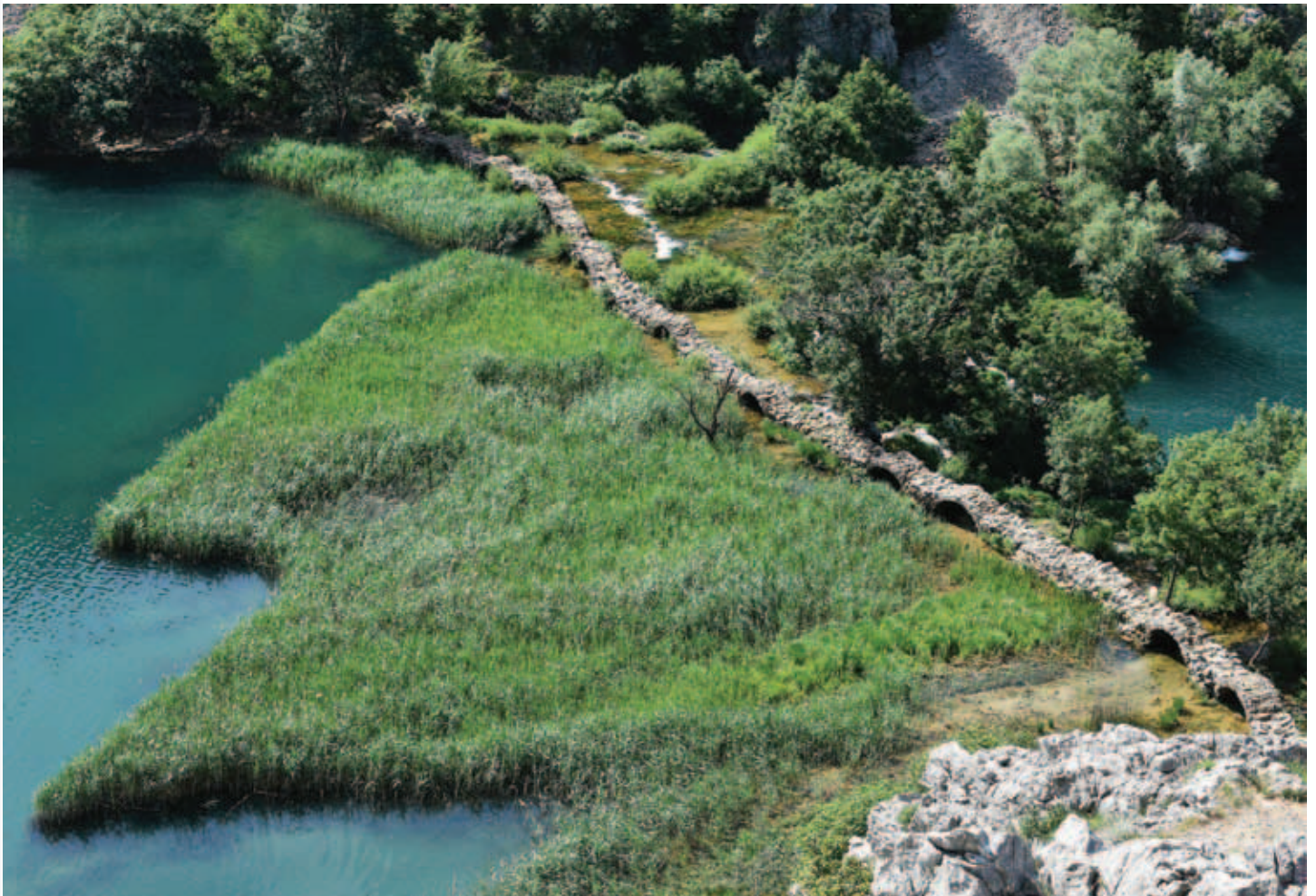
Kudin most