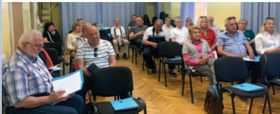
S skupščine v živo