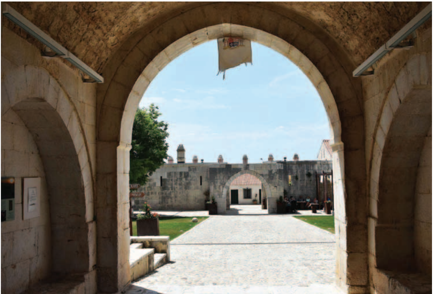
Maškovića han