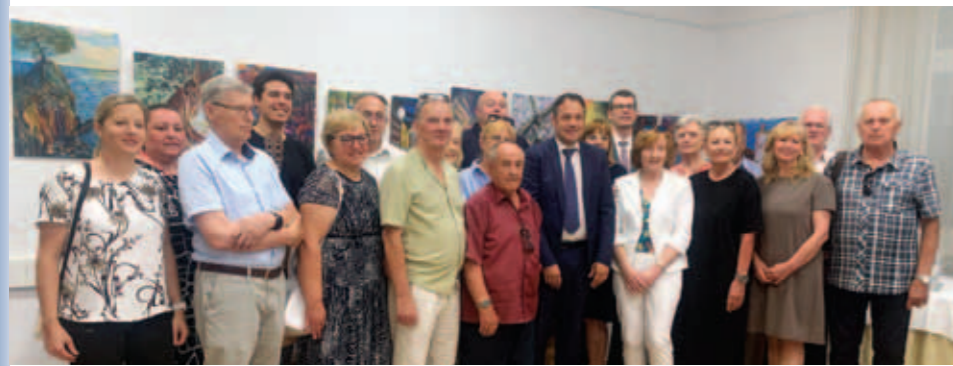
Zadovoljni udeleženci srečanja