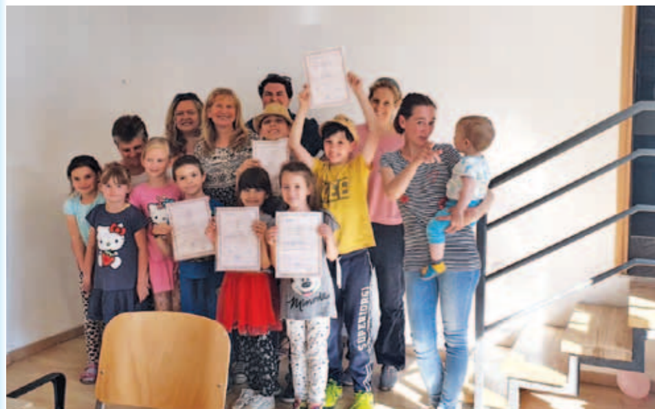
Uspešno prvo leto

Letošnje šolsko leto 2021/22 je SKD Prešeren izpeljalo DPS, prvo leto in zagotovo ne zadnje. Pouk je sprva potekal ob petkih, kasneje ob četrtnih, delovali pa sta dve skupini. Prva je bila začetniška z otroki in jo je obiskovalo pet otrok. Ker je bila po starosti zelo mešana skupina, so za vodilo imeli knjigo Križ kraž. Seveda je bilo potrebnih tudi veliko prilagoditev, kajti Križ kraž za nekatere otroke ni bil dovolj in se je v samo delo vpeljal tudi različne didaktične igre in materiale. Prav posebej so svojo moč izkazale čebelice oziroma "Bee botki", ki jih je posodil