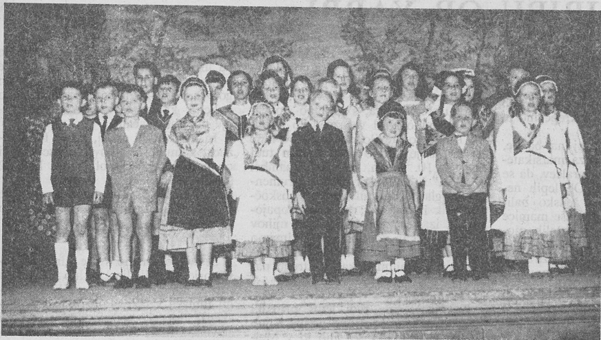
Med nastopom Slov. šole na Miklavževanju 1963.