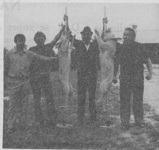
Tako so se poslavljali naši belokranjski rojaki, od svojih otrok, v Melbournu.