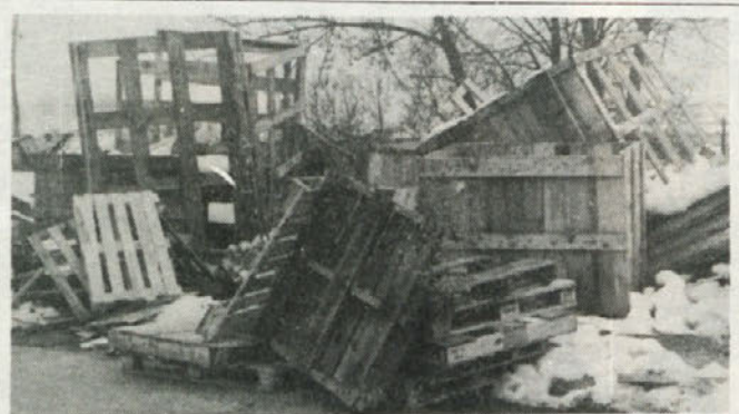
Scena iz filma Emira Kusturice? Razstava moderne umetnosti? Ne eno, ne drugo, pač pa južna stran Kodranke in volne, kjer kakor da so pozabili na akcijo reda in čistoče.