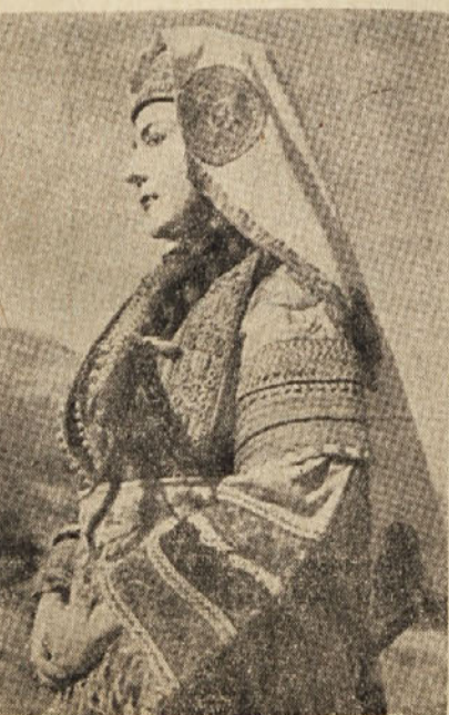
Makedonka v narodni noši

Makedonsko narodno prebujanje je priključilo na dan tudi zahtevo po boju za lastno nacionalno, versko in politično osvoboditev ter zahtevo po makedonskem književnem jeziku za Makedonce. Vmešavanje raznih propagand o-koliških držav ter akcije veselil na Balkanu so onemogočile normalni nacionalni razvoj makedonske-