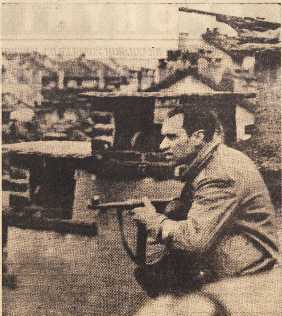
Današnji praznik vstaje praznujemo v spomin splošne ljudske vstaje, ko se je 25. aprila leta 1945 vse italijansko ljudstvo dvignilo k upor in strlo zadnji odpor okupacijskih nacističnih sil in domačega fašizma

Iz tega izhaja, da je bila za novinarja bolj važna Kruppova konferenca, kakor pa konferenca predsedstva zvezne vlade. V Bonnu se celo trdi, da sprejema Krupp v svoji vili Huegel celo več ujetih diplomatskih predstavnikov, kakor sam kancler Adenauer. Ce je ta trditev toč-