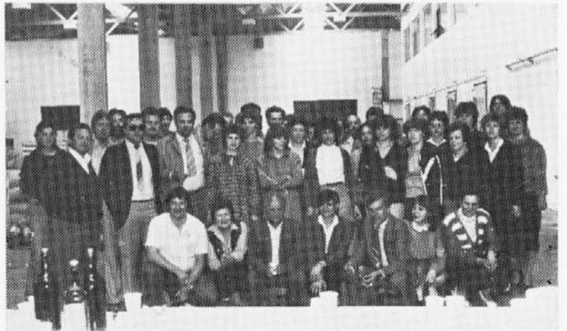
Tov. Firm med sodelavci