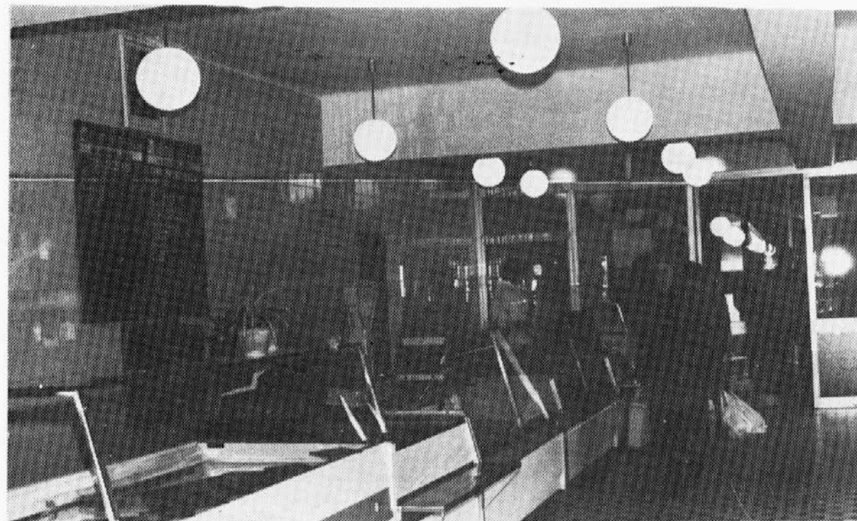
Bolj vsakdanji primer naše ponudbe