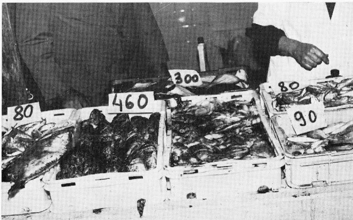
Pogled na prodajni pult v eni izmed naših ribarnic