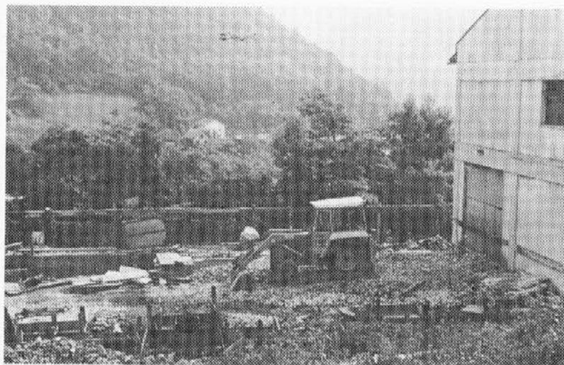
Gradnja skladišča zelišč v Mostu na Soči