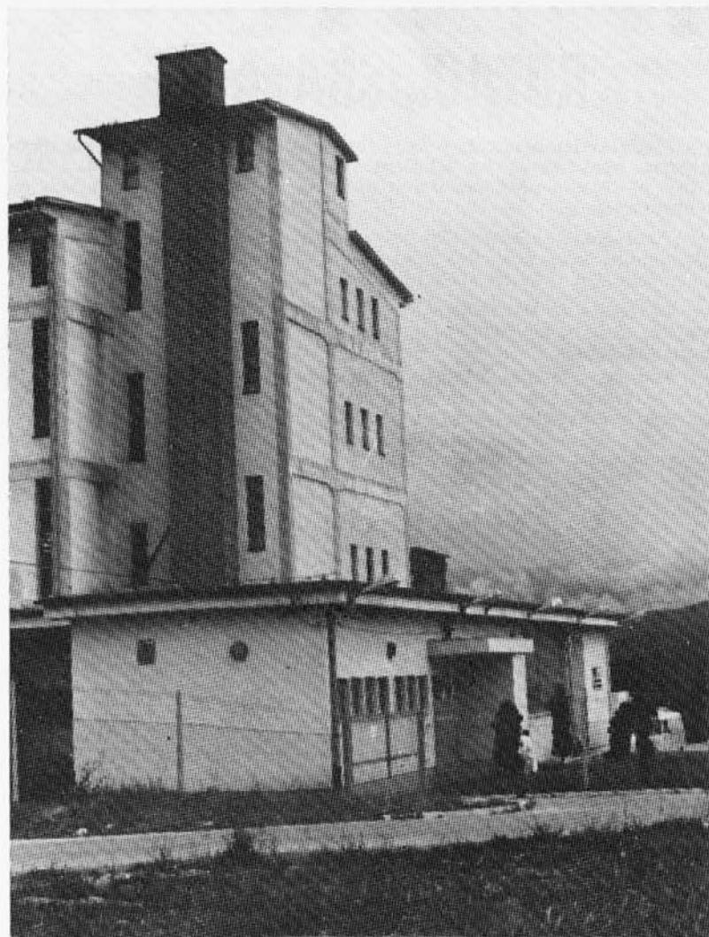
Pršutarna v Šepuljah