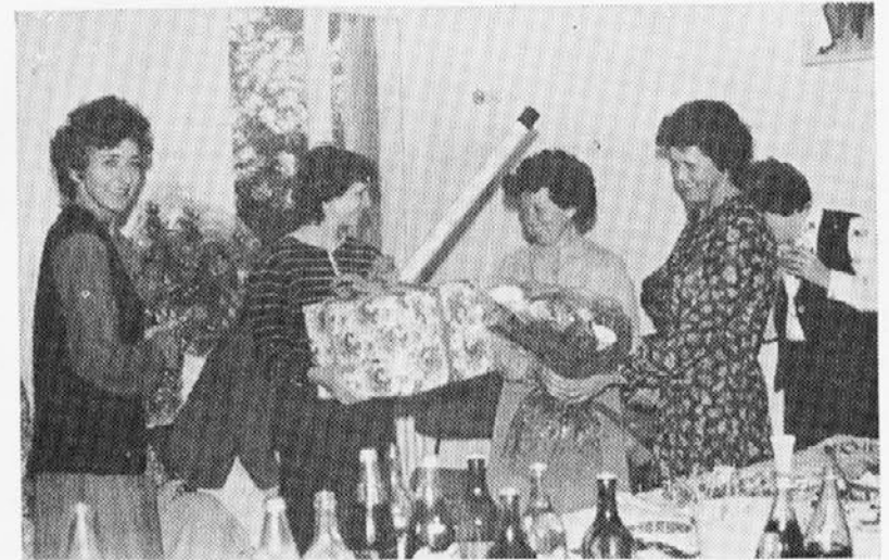
Brez darila ob takih prilikah ne gre