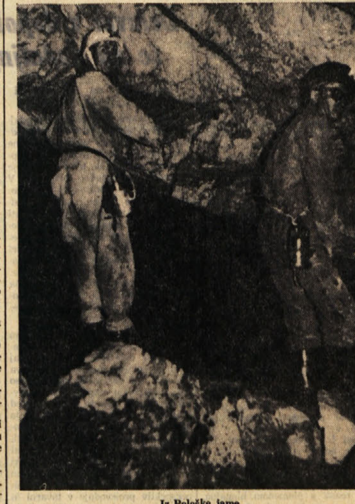
Iz Pološke jame

KOZOROG (od 21.12. do 20.1.) Neprilika vna sreča in izredna pomoč. Več populjivosti. TODEMAR (od 21.1. do 19.2.) Neke tedne bo podlegel in pot k uspehu bo odprta. Nekdo vam ponuja svoje prijateljstvo.