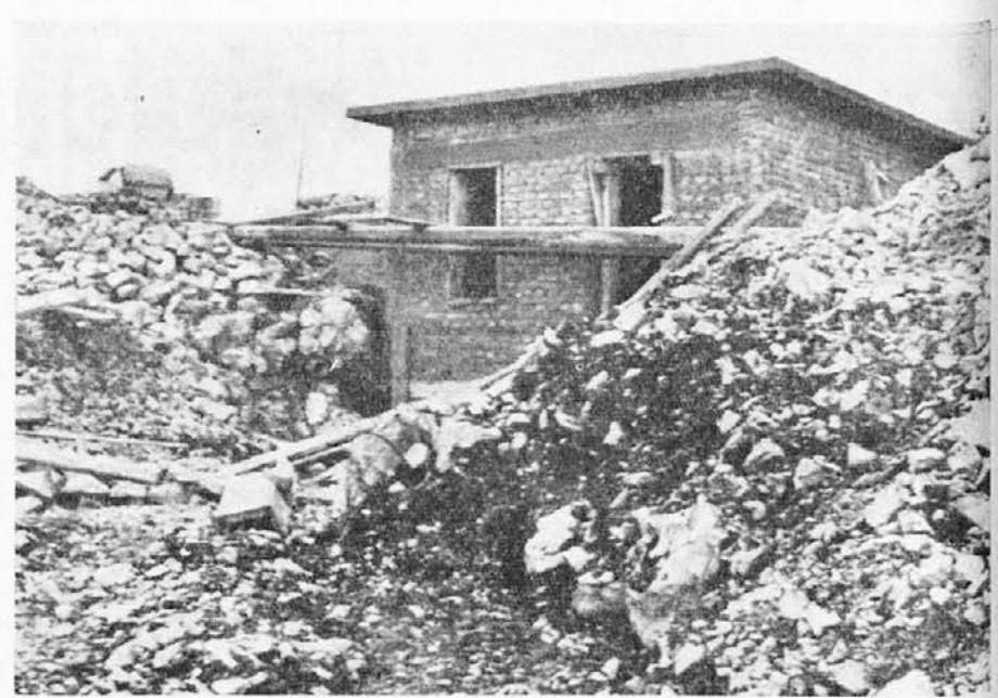
Novi vodovod v Doberdobu

Na pustno nedeljo smo imeli v Marijinem domu dobro uspešno prireditev. Na sporedu so bile štiri šaljive enodejanke: V razbojniški jami, Najdenka Majda, Nesporazum, Komik po sili. Prvi dve so vprizorile dekleta in zadnji dve skavti. Vsi so prav dobro izvedli svoje vloge. Veliko smeha je bilo. Prav zadovoljni smo zapuščali dvorano, od katere že skoraj jemljemo slovo. Upamo, da se bomo proti koncu pomladi lahko preselili v novi Marijin dom, ki prijazno zre na Rojan in okolico. Doslej je zagotovljenih 112 stolic za novo dvorano. Se okrog sto jih čaka na nove dobrotnike. Morda se bo našel tudi kak dobrotnik, ki bi nam kupil zaveso za oder v novi dvorani. Bog povrni vsem, ki so nam doslej pomagali.