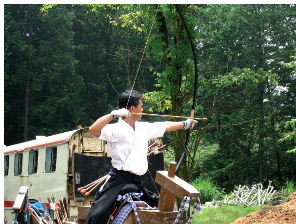
Slika 8. Lokostrelstvo na konju je na Japonskem še danes negovana veščina. Posneto v okolici historičnega mesta Nikko.

Kakunodate je predel mesta Senboku v prefekturi Akita, na severu otoka Honšu. Ustanovljen je bil leta 1620 kot