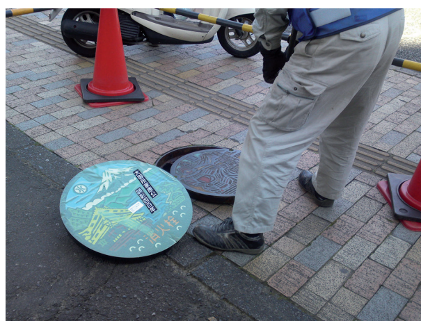
Slika 3. Menjava starejšega jaška z novim, ki v mestu Šizuoka obeležuje 400 let smrti šoguna Tokugave Iejasua.