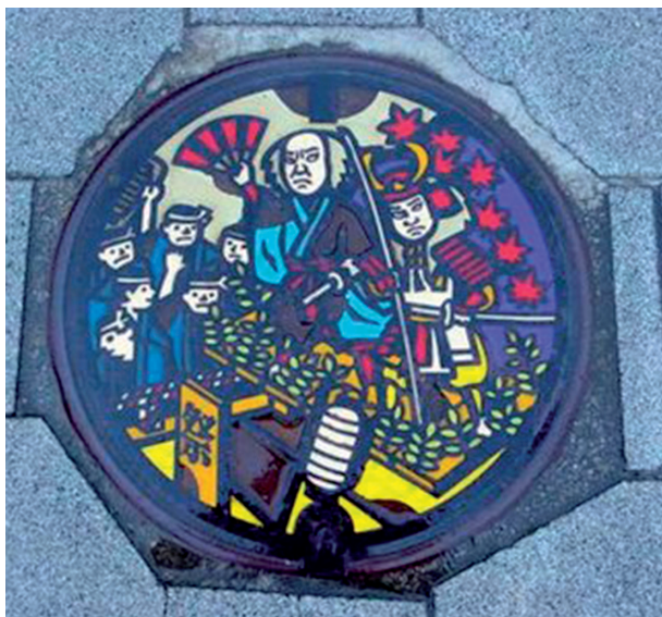
Slika 9. Pokrov jaška v mestu Kakunodate s prizori festivala Matsuri no Jama Godži.