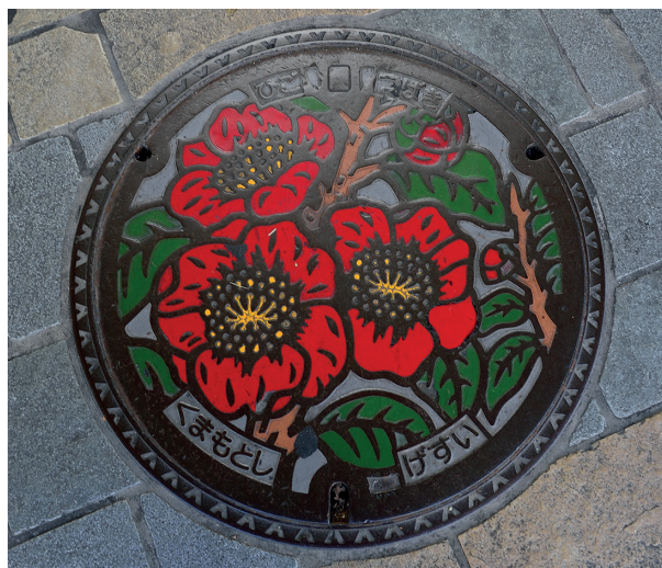
Slika 5. Kamelija Higo v mestu Kumamoto.

Čeprav se zdi, da gre za navadno kamelijo, ki je pogosta povsod na Japonskem, je na jaških mesta Kumamoto z otoka Kjušu upodobljena posebna vrsta kamelije, ki se imenuje Higo (slika 5). Ime je dobila po starem, fevdalnem imenu province. Na prostor te province je prišla v obdobju Edo in pravijo, da jo je kultiviral predvsem samurajski stan.