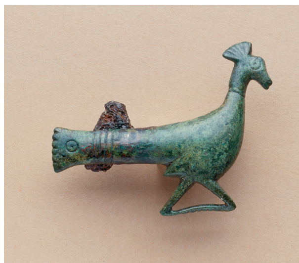
Slika 13. Fibula v podobi pava s Pristave na Bledu (foto: Narodni muzej Slovenije, T. Lauko).