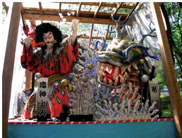
Slika 11. Eden od odrov za sprevod v času festivala Matsuri no Jama Godži.

samostojno mesto s približno 14.000 prebivalci, s katerim je gospodaril klan Satake v obdobju Edo. Danes je ta okraj najbolj znan po ohranjeni samurajski četrti Učimači ali Bukejašiki (slika 10). Nekatere hiše so stare več stoletji, v nekaterih pa še živijo potomci nekdanjih samurajev. Četrt je urejena kot skupek hiš in vrtov (slika 10), čez katere se lahko prosto sprehajamo in opazujemo njihov način življenja. Imajo manjše muzeje, trgovince