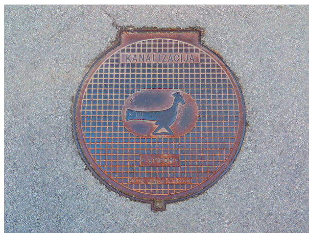
Slika 12. Pokrov jaška na Bledu v okolici cerkve Sv. Martina.