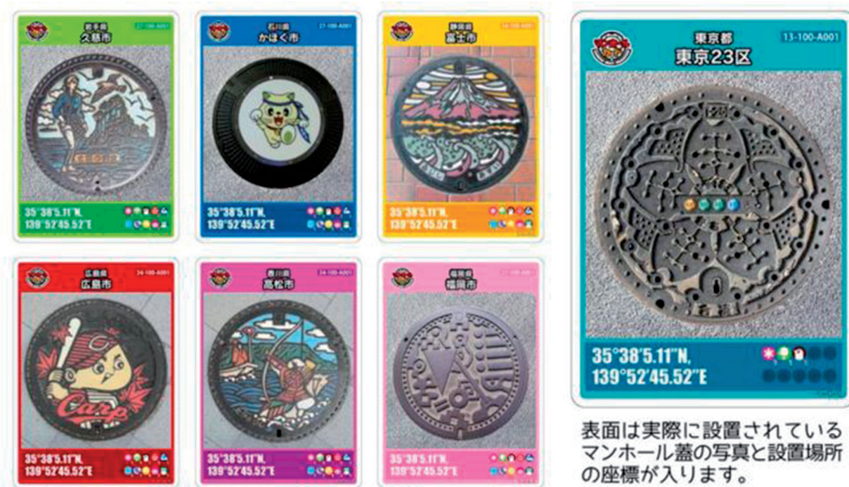
Slika 4. Primer »kartic« s fotografijami in koordinatami posameznih jaškov, namenjenim zbiralcem.

okraja/občine/upravne enote. Močna prisotnost in pomembnost dediščine samurajev v današnjem japonskem vsakdanu pa botruje tudi temu, da so številni motivi na pokrovih jaškov posvečeni prav njim. Velikokrat so upodobljene legende, včasih pomembne bitke, pomembni šoguni v vojaški opravi ali na primer rože, ki so jih lahko gojile družine iz samurajskega stanu.