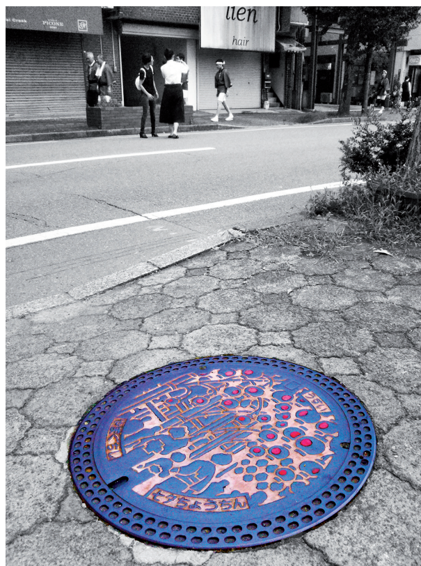
Slika 2. Primer jaška iz mesta Jamaguči. Upodobljen je znani festival lampijonov Tanabata s 500-letno tradicijo.

Drevesa in rastline so upodobljeni na več kot 50 % pokrovov za jaške. Največkrat izbran motiv je uradna roža