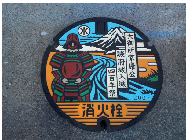
Slika 6. Pokrov jaška z motivom šokuna Tokugava Iejasu, postavljen ob 400-letnici njegove upokojitve.