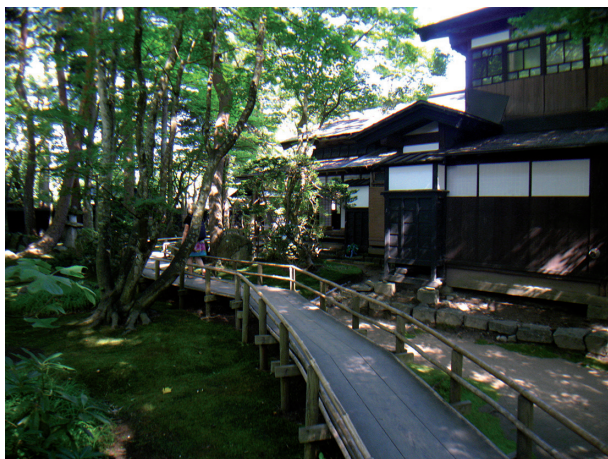
Slika 10. Samurajska četrt Učimači v Kakunodatu.

samostojno mesto s približno 14.000 prebivalci, s katerim je gospodaril klan Satake v obdobju Edo. Danes je ta okraj najbolj znan po ohranjeni samurajski četrti Učimači ali Bukejašiki (slika 10). Nekatere hiše so stare več stoletji, v nekaterih pa še živijo potomci nekdanjih samurajev. Četrt je urejena kot skupek hiš in vrtov (slika 10), čez katere se lahko prosto sprehajamo in opazujemo njihov način življenja. Imajo manjše muzeje, trgovince