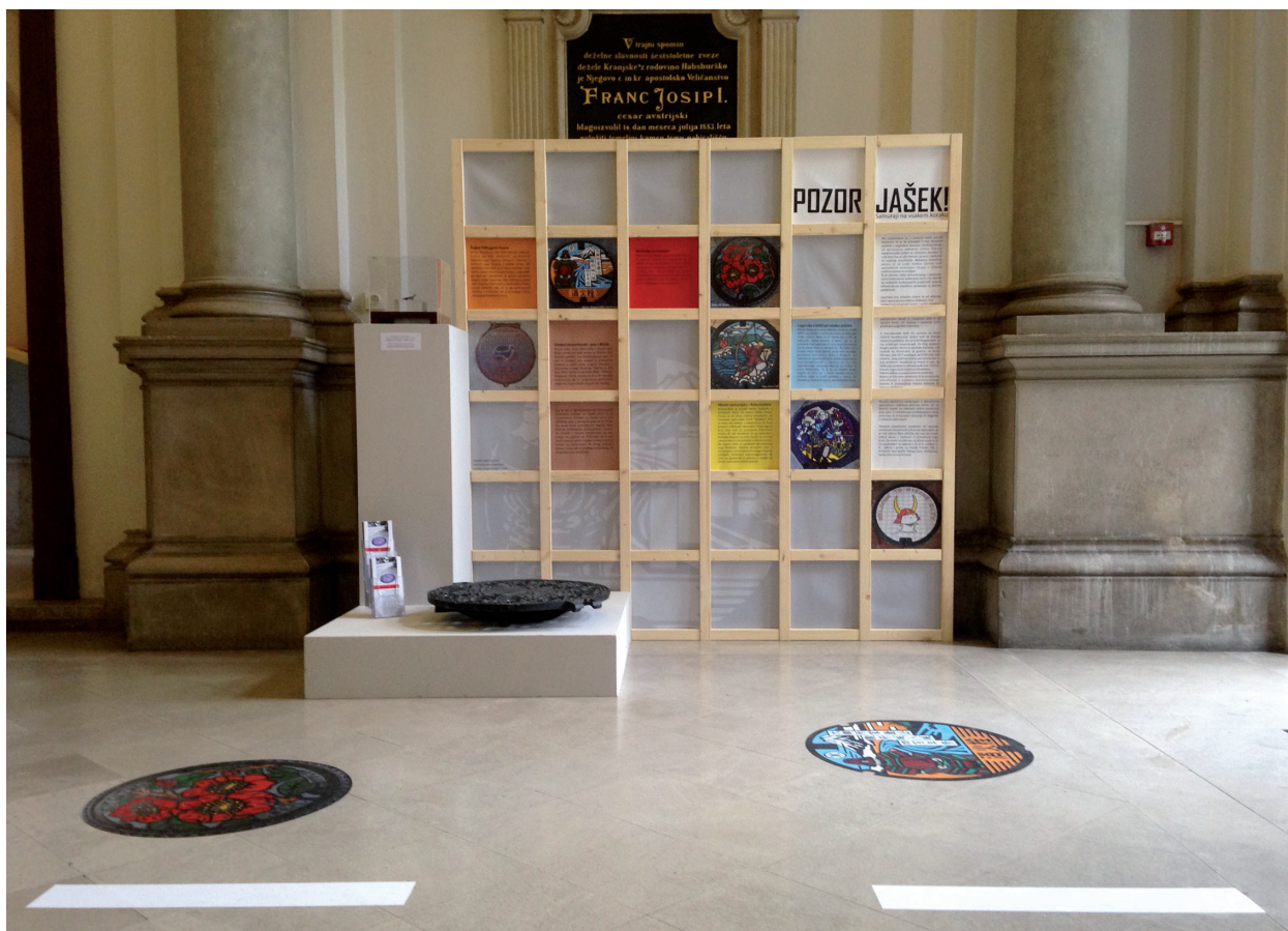
Slika 1. Vitrina meseca »Pozor jašek! Samuraji na vsakem koraku« v avli Narodnega muzeja Slovenije.

z njihovo značilno opravo in orožjem. Tako se lahko prebivalci, predvsem pa obiskovalci mesta »na vsakem koraku« seznanijo z dediščino, ki so jo mestu prepustili samuraji.