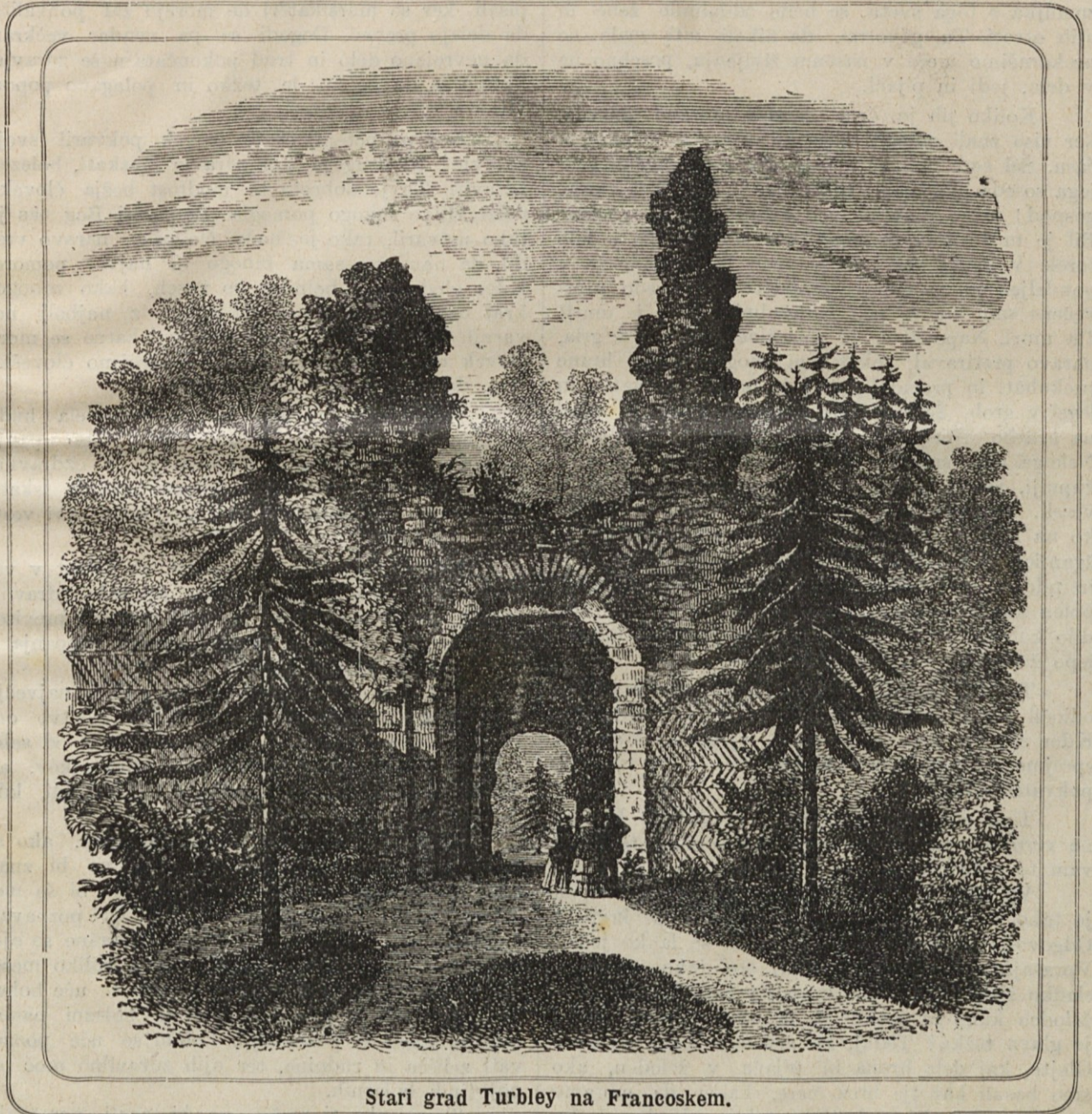
Stari grad Turbley na Francoskem.