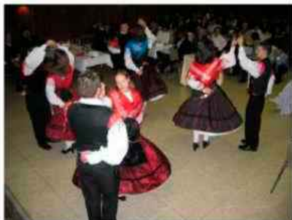
Plesna skupina nastopa