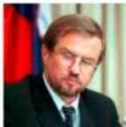
Alojz Peterle

Slovenski poslanec Evropskega parlamenta Alojz Peterle je v torek v Berlinu prejel mednarodno nagrado Merite Europeen in Gold , ki jo za zasluge v procesu