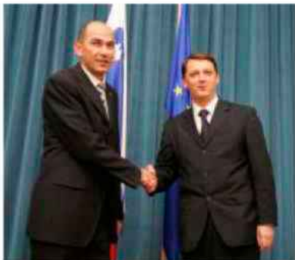
Bivši premier Anton Rop z rokovanjem predaja oblast novemu predsedniku vlade Janezu Janši