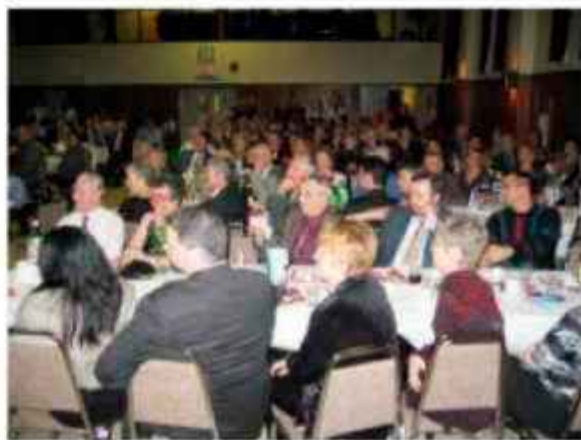
Gostje gledajo predstavo Povodni Mož

Slovenski Dom se lepo zahvaljuje vsem ki so pomagali pri organizaciji letošnjega banketa, prav tako pa tudi vsem sponzorjem ki so pripomogli da je banket tako lepo uspel. Kdor želi biti obveščen kdaj ima Slovenski Dom naslednje prireditve naj kliče na (905) 669-2365.