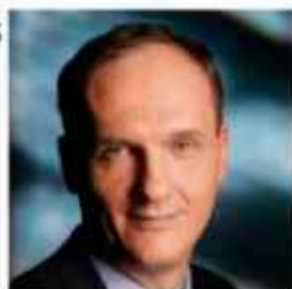
Janez Podobnik Okolje in prostor