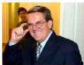
Anton Rous Kabinet