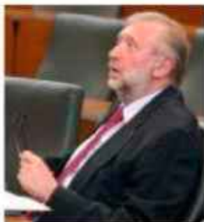
Dimitrij Rupel, Zunanji minister