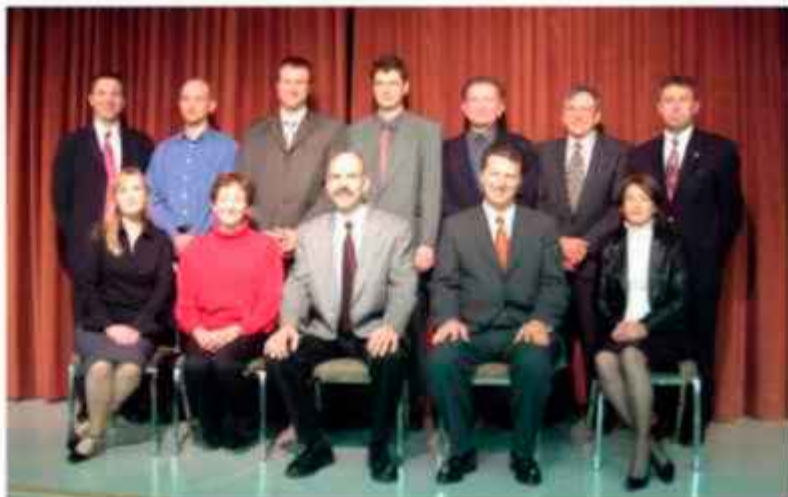
Board of Directors of Slovenia Parishes Credit Union

This vigilance on internal controls is carried out by the Credit Union's management; the Deposit Insurance Corporation of Ontario who conducts a periodic examination and inquiry into the affairs