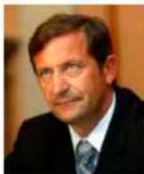
Karl Erjavec Obramba