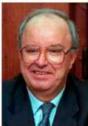
Andrej Bajuk Finance