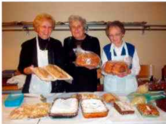
The Ladies of the Elderly Persons' Centre at Dom Lipa display their delicious baked goods at their annual Bazaar

the strudels and the cookies and the potice? Oh the delicious, delectable potice, all patiently baked with care and love by the ladies of the Canadian Slovenian community.