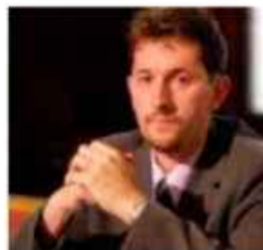
Gregor Virant Javna Uprava