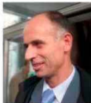
Janez Drobnič Delo, družina in socialne zadeve