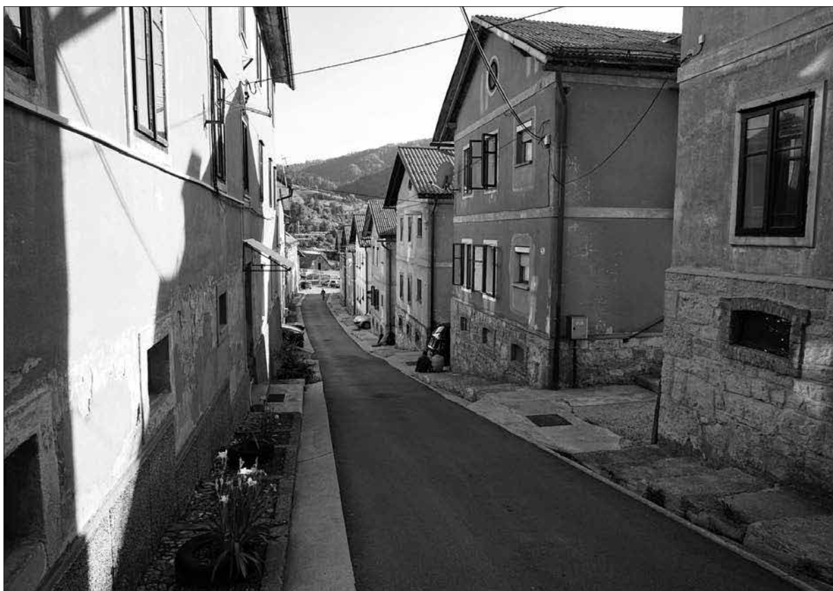
Dvodružinske delavske hiše in bloki na Rudarski ulici, 2017.