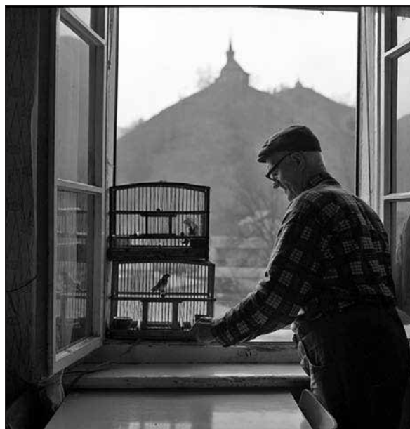
Rudar s pticami na Brusovšu, 1976.

Utilitarnost, ki se je na delavski arhitekturi kazala na zunanosti, je bila značilna tudi za okraševanje notranjosti stanovanj. Bohkov kot, ki ga v rudarskih domovanjih niso poznali, je nadomeščal na nizko omaro postavljen šturc – s steklenim pokrovom pokrit nabožni kipec. Po stenah so visele slike z nabožno vsebino in družinske fotografije, ki so jih uokvirjali v značilne umetelno rezljane okvirje. 72 Izraz velike ročne spretnosti nekaterih Idričjanov so bili tudi fuglavži – ptič-