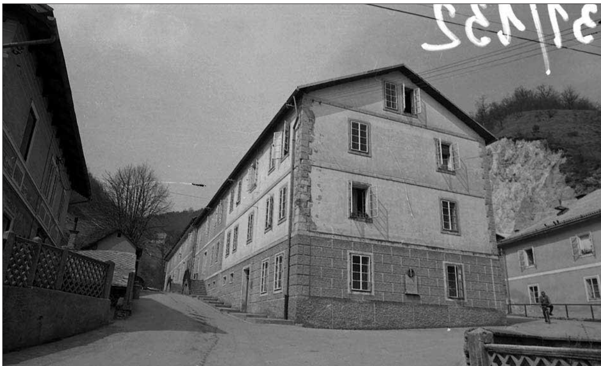
Prhavzi na Prejnuti, 1976 (fototeka SEM).

1896 ista usoda doletela še dva otroka, je to pritegnilo pozornost rudniškega zdravnika. 63 Z zdravniškim priporočilom je nato rudarska družina lahko prišla do boljšega rudniškega stanovanja.