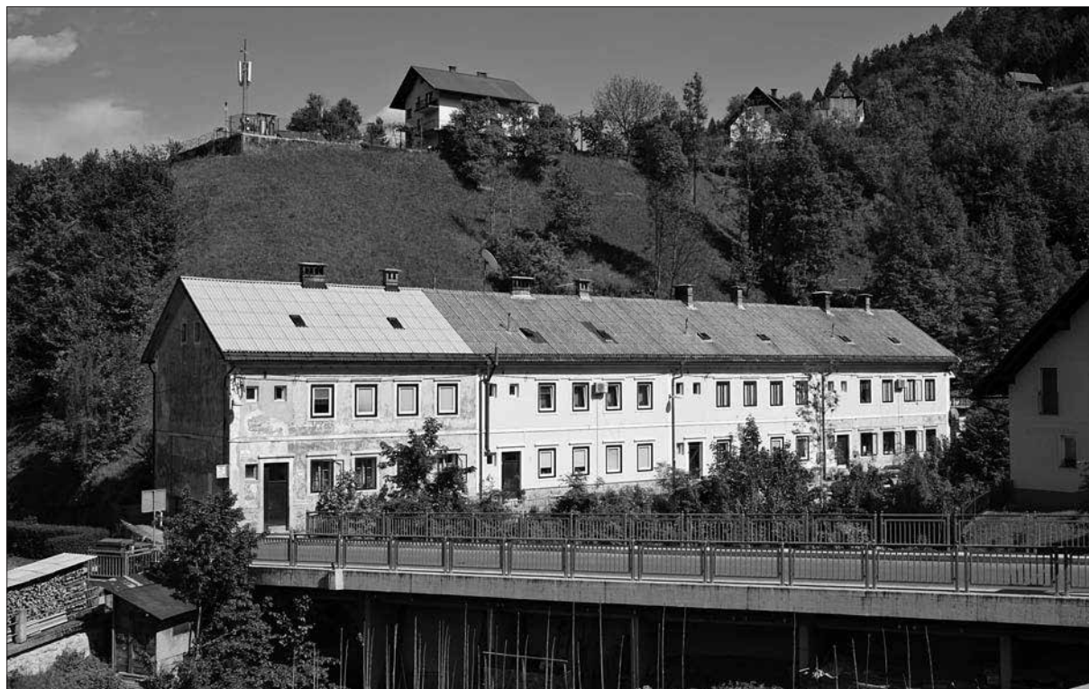
Niz prhavzov v Grapi, 2017.

lijansko upravo v drugi polovici dvajsetih in začetku tridesetih let 20. stoletja. 36 Predel Brusovše je tako pred dobrim stoletjem izkazoval podobo sodobne industrijske soseske: več deset dobro grajenih, svetlih in zdravih stanovanj, postavljenih zraven tovarne cinoobra in poslopij nove žgalnice živosrebrove rude, ki so jo leta 1880 z levega preselili na desni breg Idrijce. Nad vsem skupaj je na hribu dominiral mogočen žgalniški dimnik. 37