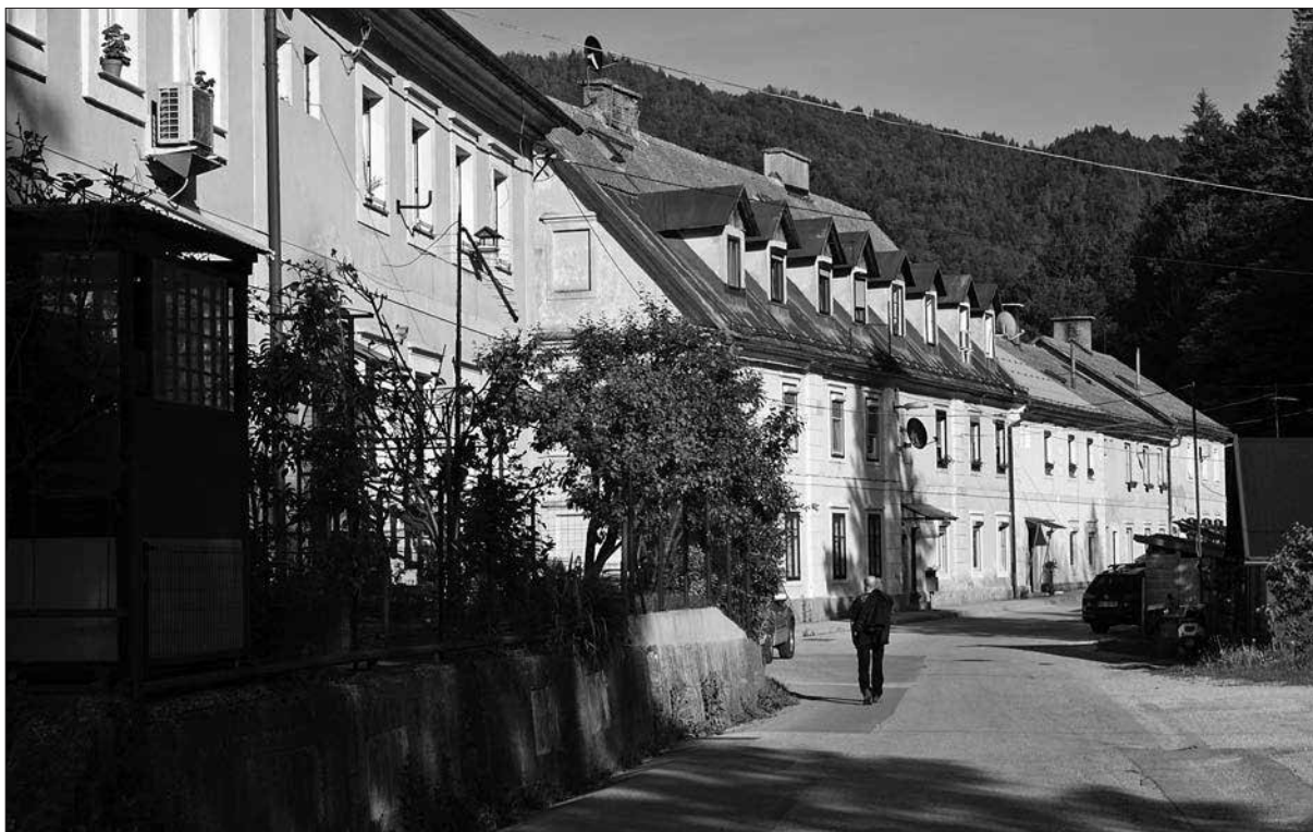
Niz prhavzov v Cegovnici, 2017.

Gačnik in pravokotno na cesto postavljen niz štirih enonadstropnih blokov se je s svojo dvokapno streho, utilitarno oblikovano fasado in razporeditvijo sob v stanovanju postavil ob bok ostali delavski arhitekturi v mestu.