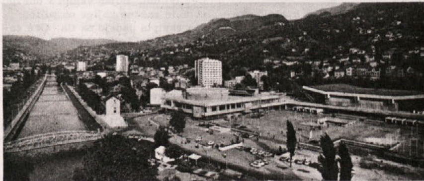
Dvorana Skenderija, kjer je bil kongres samoupravljalcev

Razumljivo je, da je bilo največ zanimanja za politiko dohodka in dohodkovne odnose, za samoupravno sporazumevanje in družbeno dogovarjanje kot temelj bodočih samoupravnih odnosov ter za kadrovske politiko in izobraževanje.