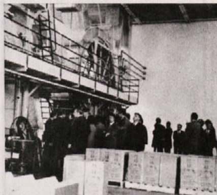
Ogled novega stroja za proizvodnjo Selotejpa, ki smo ga v glavnem izdelali doma.

nijo novi ustavni amandmaji ne samo večje pravice naših narodov, ki želijo živeti v jugoslovanski socialistični skupnosti, marveč tudi osnovo za nadaljnji samoupravni razvoj.