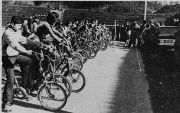
Tekmovanci pred začetkom tekmovanja poslušajo pozdravni nagovor

V starejši skupini, ki jo sestavljajo učenci sedmih in osmih razredov je ekipno zmagala osnovna šola Ormož pred Veliko Nedeljo, Tomažem,