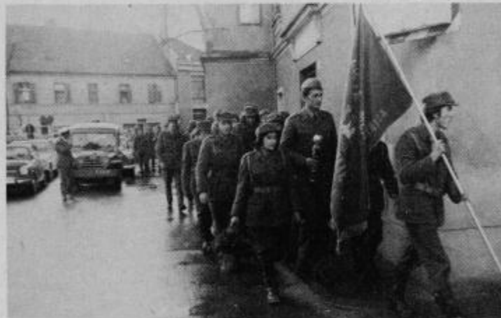
Prihod zvezne štafete v Slov. Bistrico.