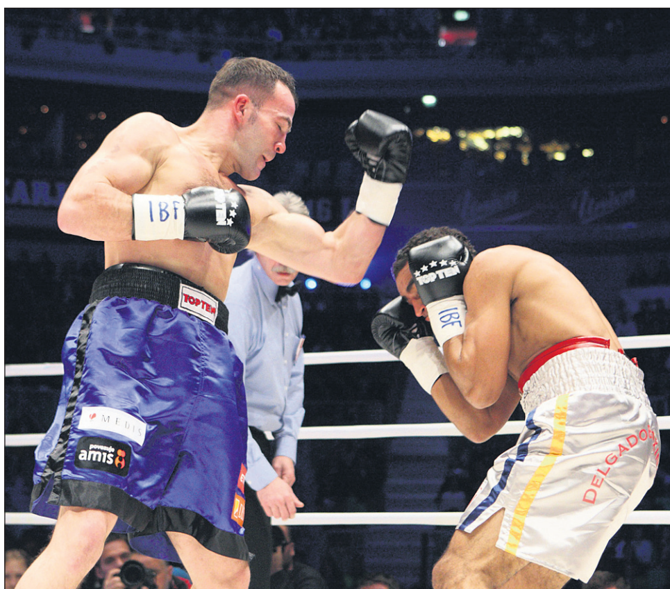
Dejan Zavec: »Mene sicer zanimajo borci, ki so na svetovni lestvici pred menoj, a na žalost si tekmecev ne izbiram sam.«

D. Zavec: »Velikokrat se tudi sam sprašujem, ali so rezultati na testiranjih resnični: kažejo namreč na to, da sem pred vsakim nadaljnjim dvobojem bolje pripravljen. Mislil sem namreč, da zaradi mojih let ne bo več fizičnega napredka, a še zdaleč ni tako. Tako sem npr. na zadnjih testiranjih dosegel boljše rezultate kot pred dvobojem z Jackiewiczem. Verjetno je