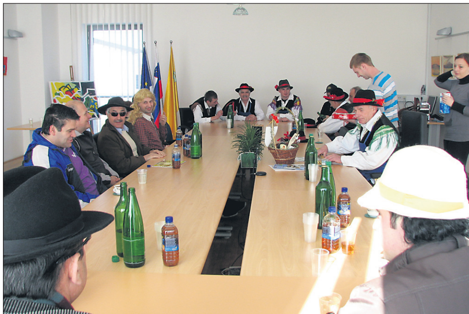
Oraški občinski svet iz lukarske občine je po enomesečni vladavini bojda lepo napolnil prazno občinsko blagajno; razen če ni denar odromal v mariborsko nadškofijo.