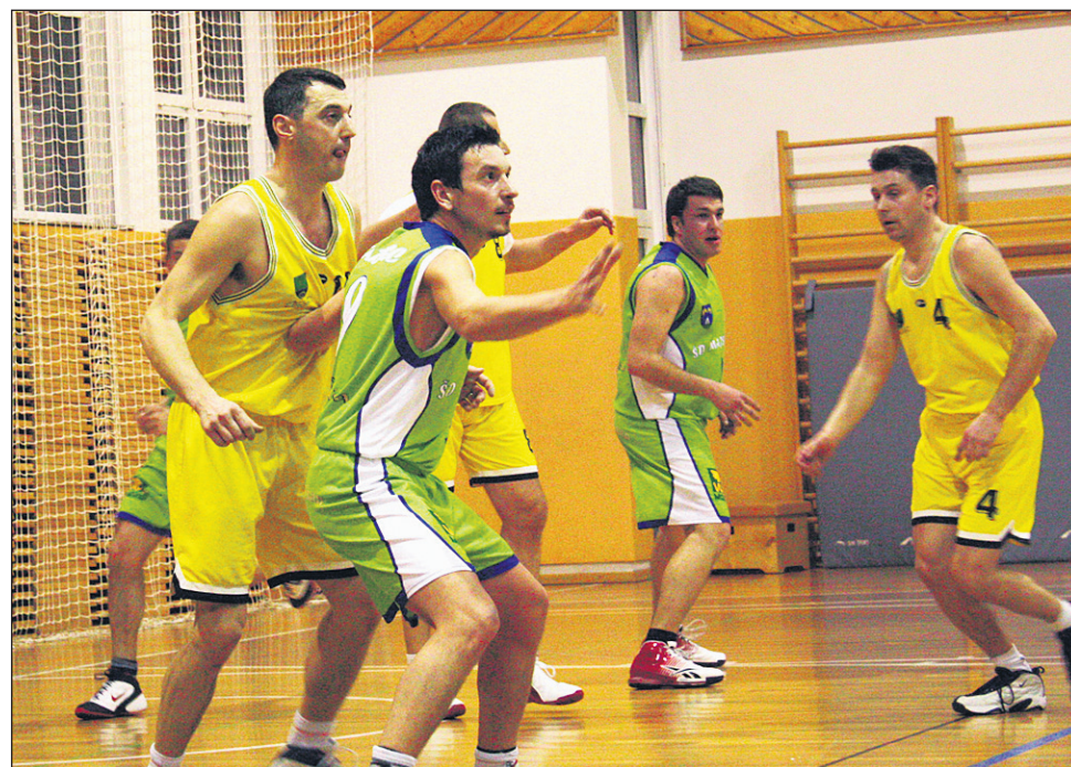
Utrinek s tekme Optika Pelikan ŠDM - Starše 2, ki so jo dobili slednji (v rumenih dresih).