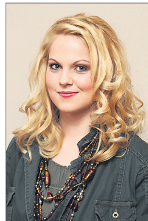
... in pozneje