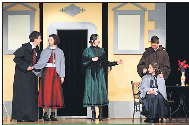
Nova uspešna premiera gledališke skupine KD Skorba. Tokrat so na oder postavili lahko romantično komedijo pod naslovom Ceciliya ali šola za očete Jeana Anouilha.