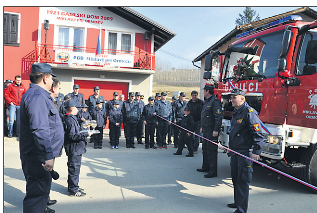
Na pustno soboto je bilo v Miklavžu pri Ormožu zelo svečano.