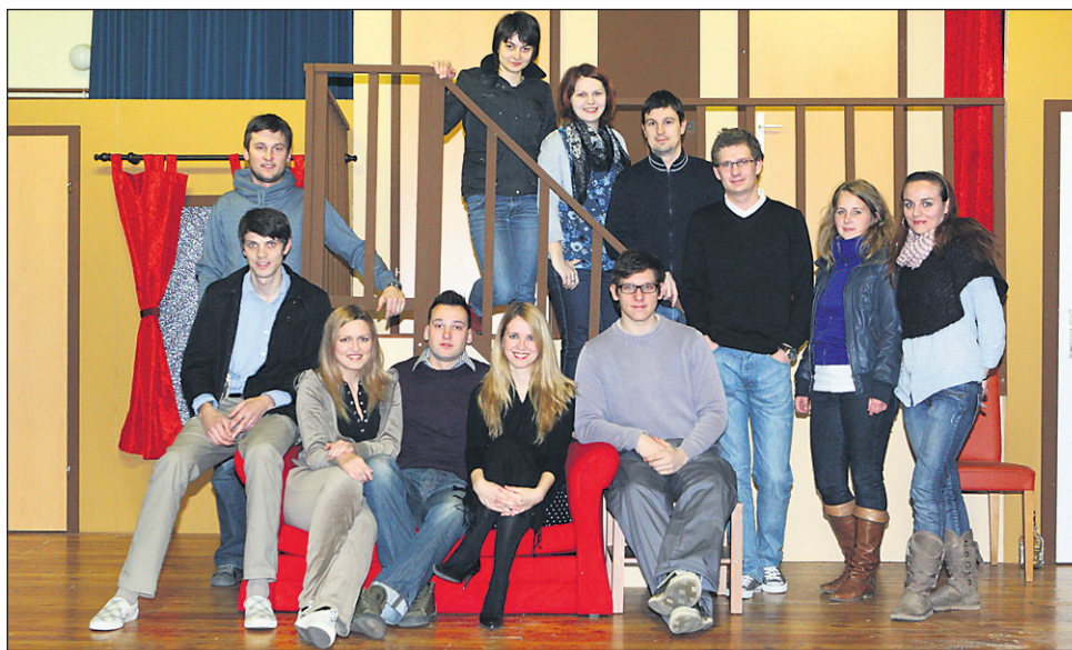
V soboto, 12. marca, ob 19.30 vabijo v Kulturno dvorano Draženci na premiero komedije Hrup za odrom.

pričeli v jeseni. Pred premiero so opravili 45 vaj, nobena ni trajala manj kot tri ure.