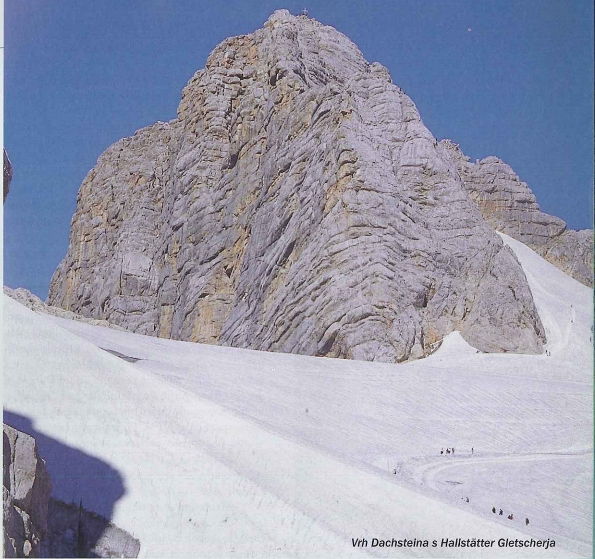
Vrh Dachsteina s Hallstätter Gletscherja

označenem križišču pa zavijemo na desno (cestnina) in se po serpentinah strmo dvignemo do spodnje postaje dachsteinske žičnice. Do tja je iz Ljubljane približno 230 km. Gondolska žičnica nas v nekaj minutah pripelje 1000 m više, na Hunerkogel, izhodišče naše ture.