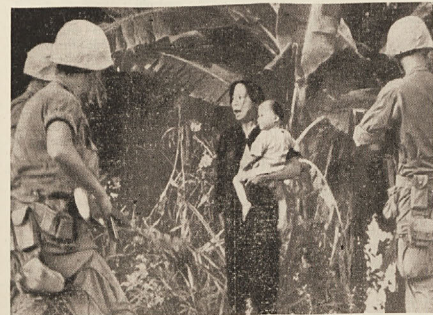
Strahoten prizor iz vietnamske tragedije. Možje in fantje se kot partizani borijo proti agresorju, žene in otroci so se zatekli v gozdove, kjer iščejo zavetje, saj domov ne morejo in ga niti več nimajo. Tem ljudem bo tudi naša mladina priskočila na pomoč. Darovala bo kri za ranjene borce

Iz sestavka Ignacija Ote pa povzemamo naslednje: Pevski zbor «Vasilij Mirk» je imel v minuli sezoni 17 nastopov. Na tekmovanju zborov v Gorici je zbor dosegel 3. mesto. Veliko zadoščenje je zbor imel z nastopom v dvorani Slovenske Filharmonije v Ljubljani. Zbor je nastopil tudi na Reki ter prenetil tamkajšnjo javnost.