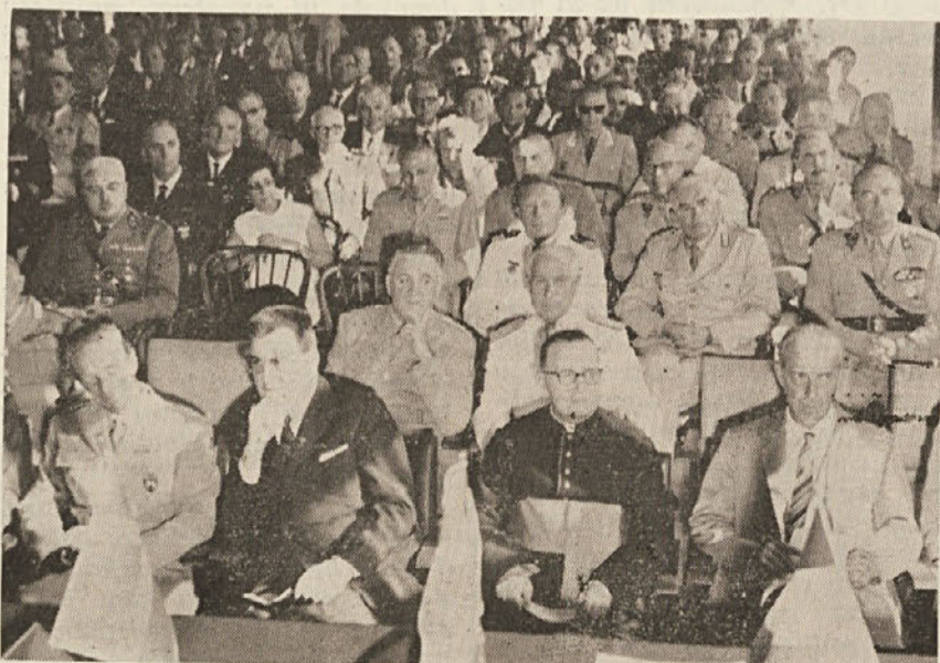
Otvoritve kongresa rezervnih oficirjev NATO se je udeležil tudi tržaški župan. Ni ga motilo dejstvo, da so bili v dvorani tudi predstavniki grškega fašističnega režima. Kje je njegova solidarnost z grškimi antifašisti?