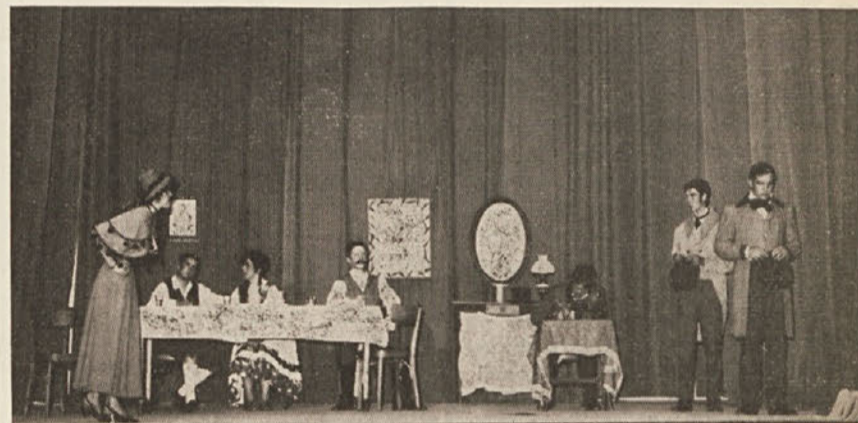
Dramska skupina P. D. Prosek - Kontovel

«Z gostovanjem v Križu z Linhartovo veseligr 'Zupanova Micka' smo zaključili ljudsko-prosvetno delovanje za sezono 1966-67. Ako nekoliko pogledamo nazaj in kritično ocenimo delovanje v ravnokar zaključeni sezoni, smo lahko nadvse zadovoljni. Zelo razveseljivo je dejstvo, da smo imeli zelo veliko šte-