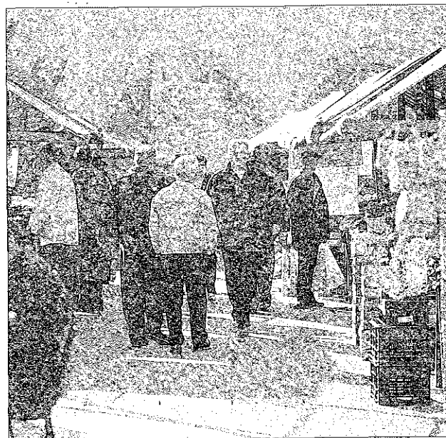
Sl. 1: Vrvež na koprski tržnici.

Privilegirano pozicijo in odnos lokalnih prebivalcev do italijanske manjšine pa se lahko razume tudi v kontekstu razmišljanj o občih odnosih Slovencev do drugih narodov. Tako kot vsak narod imajo tudi Slovenci izoblikovan hierarhični odnos do drugih narodov glede na nekatere pozitivne (npr. prepoznavna in dolgoletna kulturna tradicija, mednarodno ugleden politični in ekonomski položaj, kulturna sorodnost, tradicija dobrih mednarodnih odnosov idr.) in negativne (relativna politična in ekonomska nepomembnost v mednarodnem