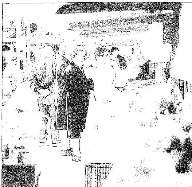
Sl. 2: Kraj srečanj in izmenjav. Fig 2: A meeting and trading place.

prostoru, splošna ekonomska nerazvitost, kulturna oddaljenost idr.) kazalce. Na lestvici pozitivnega-negativnega vrednotenja pripadnikov drugih narodov se Italijani uvrščajo na pozitivni pol, skupaj z drugimi narodi predvsem zahodne Evrope, medtem ko se narodi vzhodne Evrope in Balkana umeščajo med relativno manj "cenjene" narode. Omenjeni obči odnos do narodnih skupnosti se tako neposredno odraža tudi v odnosu do posamičnih imigrantskih skupin, ki so se naselile na preučevanem območju slovenske Istre. To tezo posredno potrjuje tudi razlika v družbenem položaju italijanske