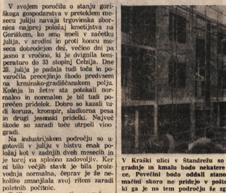
V Kraški ulici v Štandrežu so v polnem teku nove stanovanjske gradnje in kmalu bodo nekatere stavbe lahko sprejele nove stanovalce.

V Trzinu obetajo nove industrijske objekte - Položaj v kmetijstvu nekoliko prizadela toča - Nove gradnje v Štandrežu - Cestna povezava na meji