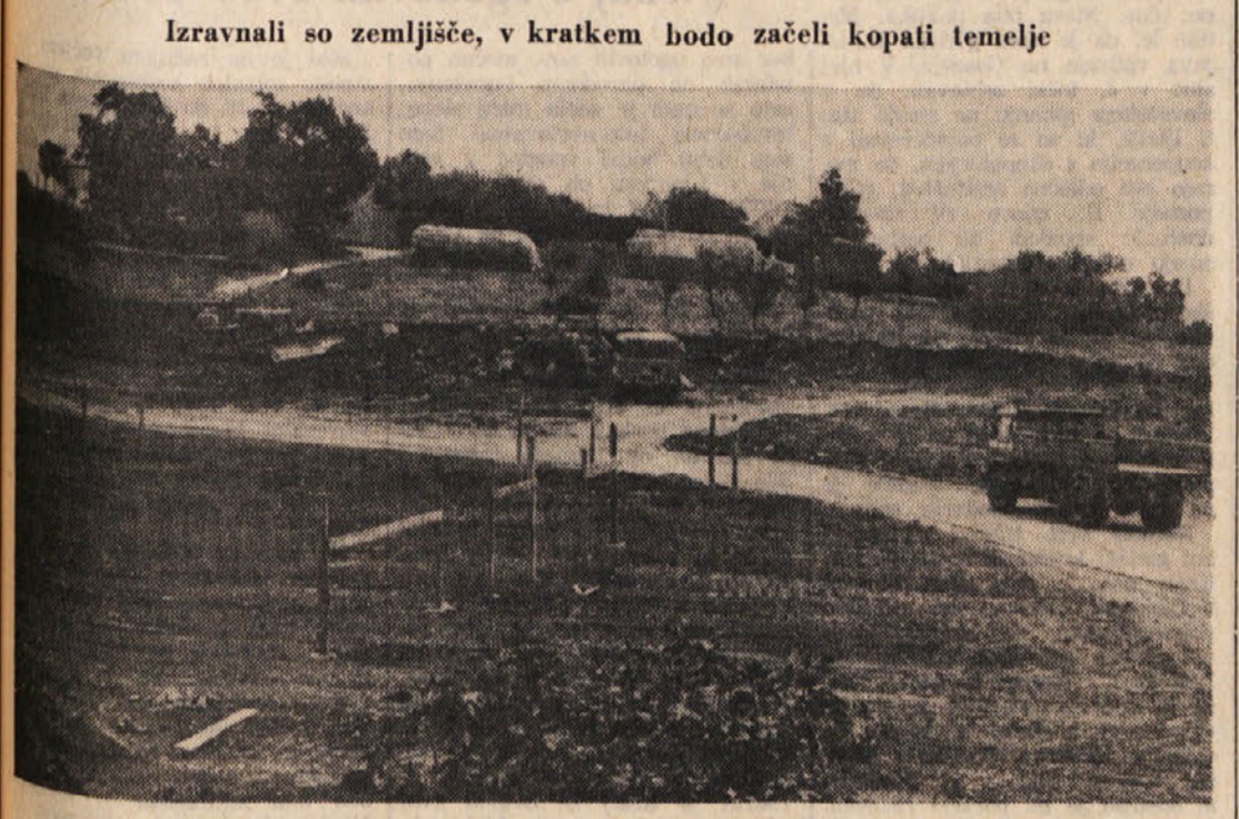
Izravnavali so zemljišče, v kratkem bodo začeli kopati temelje