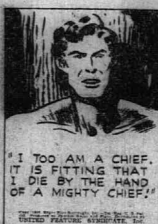
"I TOO AM A CHIEF. IT IS FITTING THAT I DIE BY THE HAND OF A MIGHTY CHIEF."

Sedaj ni ničesar več bilo med Tarzanom in smrtjo, kot njegov bistri um. Začel je govoriti proti poglavarju.