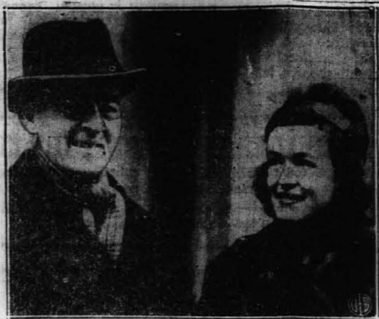
Sir S. Cripps je bil nedavno poslan od angleške vlade v Indijo, da taj predloži načrt za podelitev deželi neodvisnost. Gornja slika ga kaže v družbi s hčerjo A. Harrimana, ameriškega lend-lease upravitelja v Londonu.