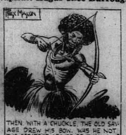
THEN WITH A CHUCKLE THE OLD SAVAGE DREW HIS BOW. WAS HE NOT THE GREATEST ARCHER OF THEM ALL?

Poveljnik se je čutil počaščenega. Pomignil je, naj strelci stopijo na stran.