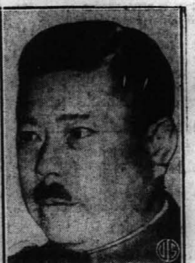
Japonski general Jamašita, ki si je pridobil sloves z zavzetjem Malaje in Singapora, je bil nedavno poslan proti četam MacArthurja na Filipinih.

ki. Ali bodo sedaj Afriko na novo razdelili, ali mislijo na ustanovitev Panafrike pod nadzorstvom "nove Evrope"?