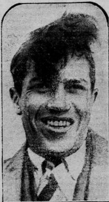
Lyle Womack se smeje

je velika prijateljica živali. Naša slika jo prikazuje sredi njenih ljubljencev na vrtu Bele hiše, palače predsednika ameriških Združenih držav v Washingtonu.