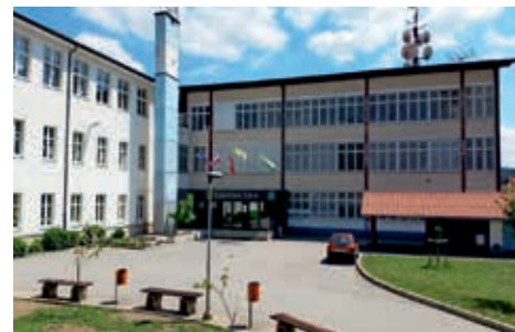
OŠ pred sanacijo