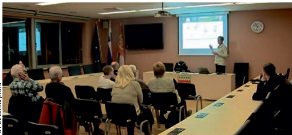
Vir: Občinska prava

Komunalno podjetje Logatec in Občina Logatec