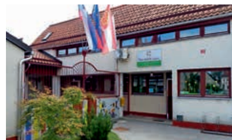
Vrtec pred sanacijo