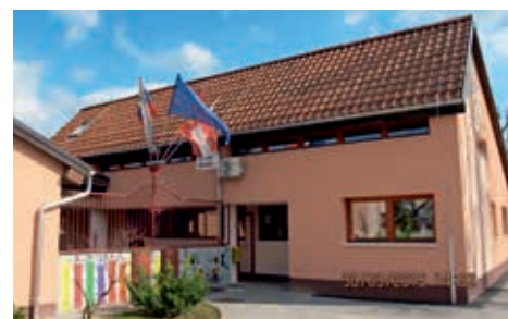
Vrtec po sanaciji