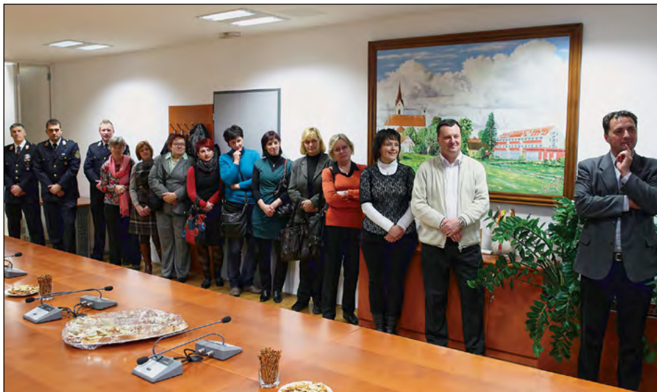
Utrinek s prijetnega ponovoletnega druženja v prostorih občine, kjer so se zbrali številni predsedniki društev in organizacij.