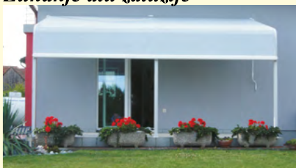
Tenda z nogami