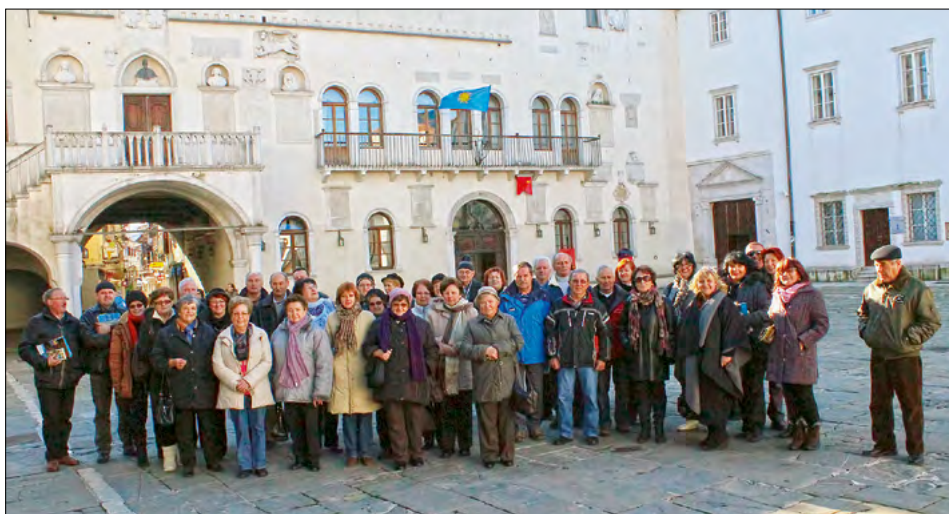
Osrednji del Kopra je trg pred Pretorsko palačo, ki smo jo izbrali za kuliso našega skupinskega posnetka.

Težko je bilo najti primeren datum, ki bi vsem ustrezal za udeležbo na strokovni ekskurziji TD Mitra Hajdina v Slovensko primorje – na Obalo in v njeno zaledje. V soboto, 25. januarja, smo kljub pri nas neobetavni vremenski napovedi krenili za soncem. In smo ga čakali. Teden dni zatem bi naša pot ob naravni katastrofi, ki nas je doletela ob snegu, ledu, žledu in umiranju dreves v gozdovih, bila nemogoča.