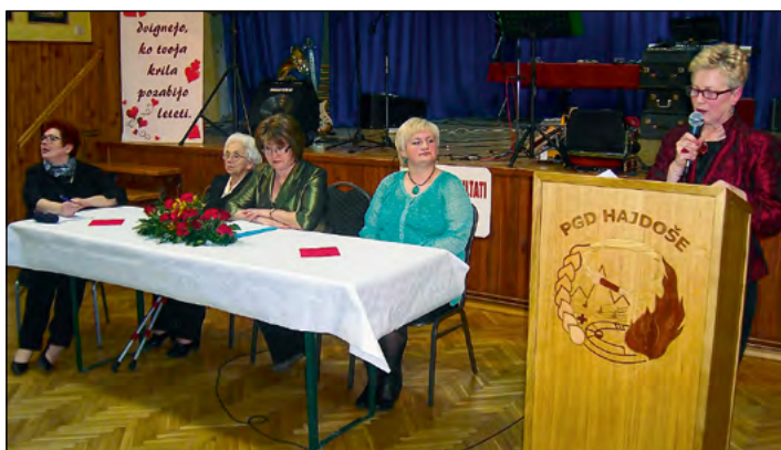
Utrinek z delovnega srečanja v Hajdošah, na katerem so predstavili delovanje društva žensk v minulem letu.