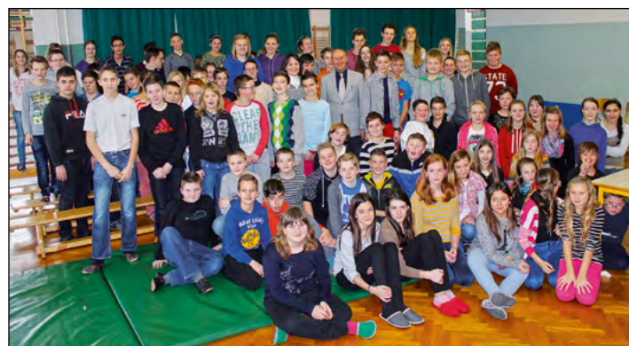
Pri višji stopnji je bilo kar nekaj vprašanj za avtorja mnogih mladinskih zgodb, ki so nastale po dogodkih, ki se tudi nam vse pogosteje dogajajo.