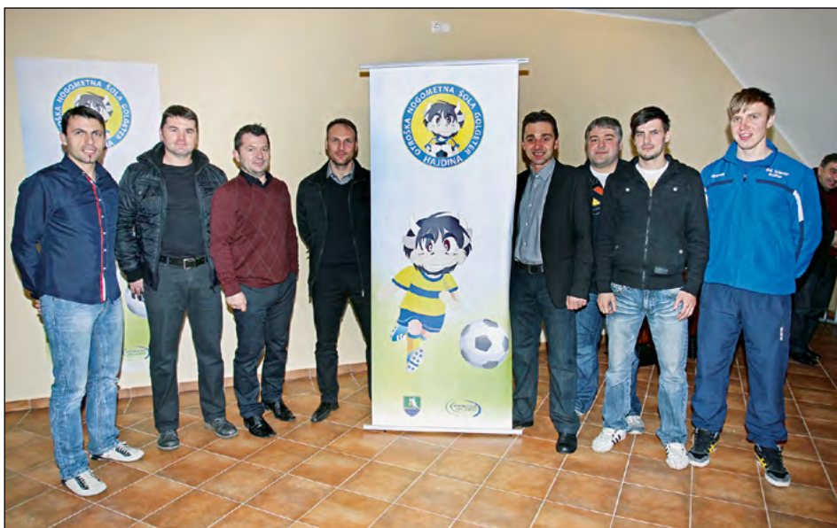
Ekipa trenerjev ONŠ Golgeter Hajdina