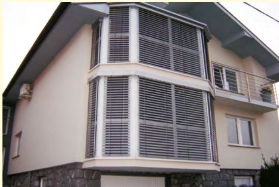
Zunanje alu žaluzije