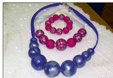
Spretne roke so ustvarile modne izdelke.