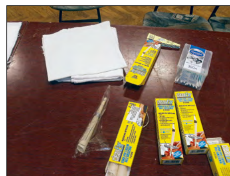
Tulci za čiščenje ušes so na voljo tudi v prodaji, najpogosteje v lekarnah, cene pa različne.

Za izdelavo tega preprostega tulca uporabljamo dokaj preprost material – kose tkanine čistega bombažnega platna v velikosti 20 x 20 cm, ki ga v celoti povoskamo z voskom goreče sveče, še toplega zvijemo na svinčnik in počakamo, da se ohladi ali strdi. Naredimo ga lahko tudi iz ožjega in daljšega traku bombažnega platna in enako povoskanega še vročega navijemo na ročaj kuhalnice ter izdelamo tulec, ki se mora prav tako ohladiti in strditi za nadaljnjo uporabo.