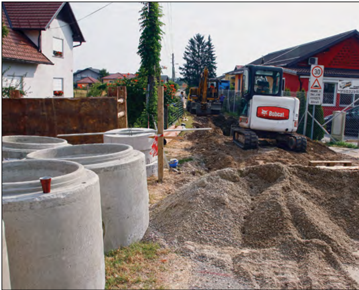
V občini Hajdina dela na področju kanalizacije potekajo nemoteno.

Na območju občine Hajdina se izgradnja kanalizacije izvaja v skladu s sprejetimi občinskimi, državnimi in evropskimi dokumenti. Vsi napori so usmerjeni k izboljšanju naravnega okolja kakor tudi k zaščiti in varovanju podtalnice, saj se zavedamo, da pretežen del občine obsegajo vodovarstvena območja, iz katerih se oskrbuje z vodo okrog 18.000 občanov naše in sosednjih občin.