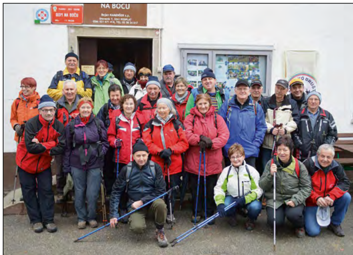
Utrinek s silvestrskega pohoda na Boč

Planinci PD Hajdina smo z zadnjim silvestrskim pohodom na Boč uspešno sklenili minulo leto. Od načrtovanih 33 pohodov smo jih uspešno izvedli 27, drugi so bili odpovedani zaradi slabih vremenskih razmer.