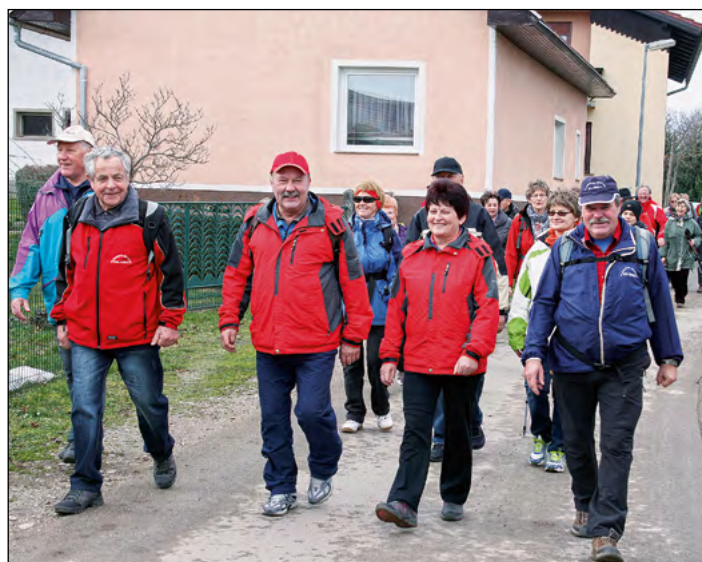
Prihod Vincekovih pohodnikov v Skorbo

V Planinskem društvu Hajdina so se odločili, da bodo obudili lep vinogradniški običaj, povezan z zavetnikom vinske trte sv. Vincencem, ki goduje 22. januarja. V čast temu zavetniku so že v soboto, 18. januarja, organizirali prvi pohod po občini Hajdina.