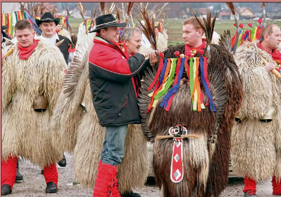
Še zadnje priprave