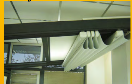
Pergola - tenda