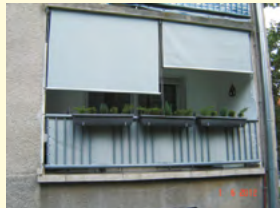
Roloji za balkone