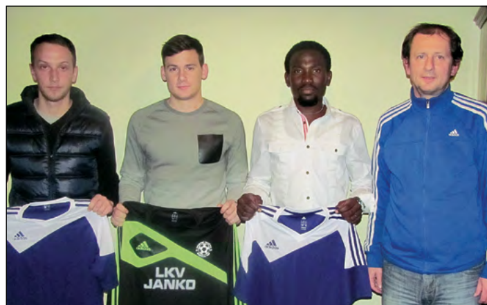
Okrepitev NK Gerečja vas