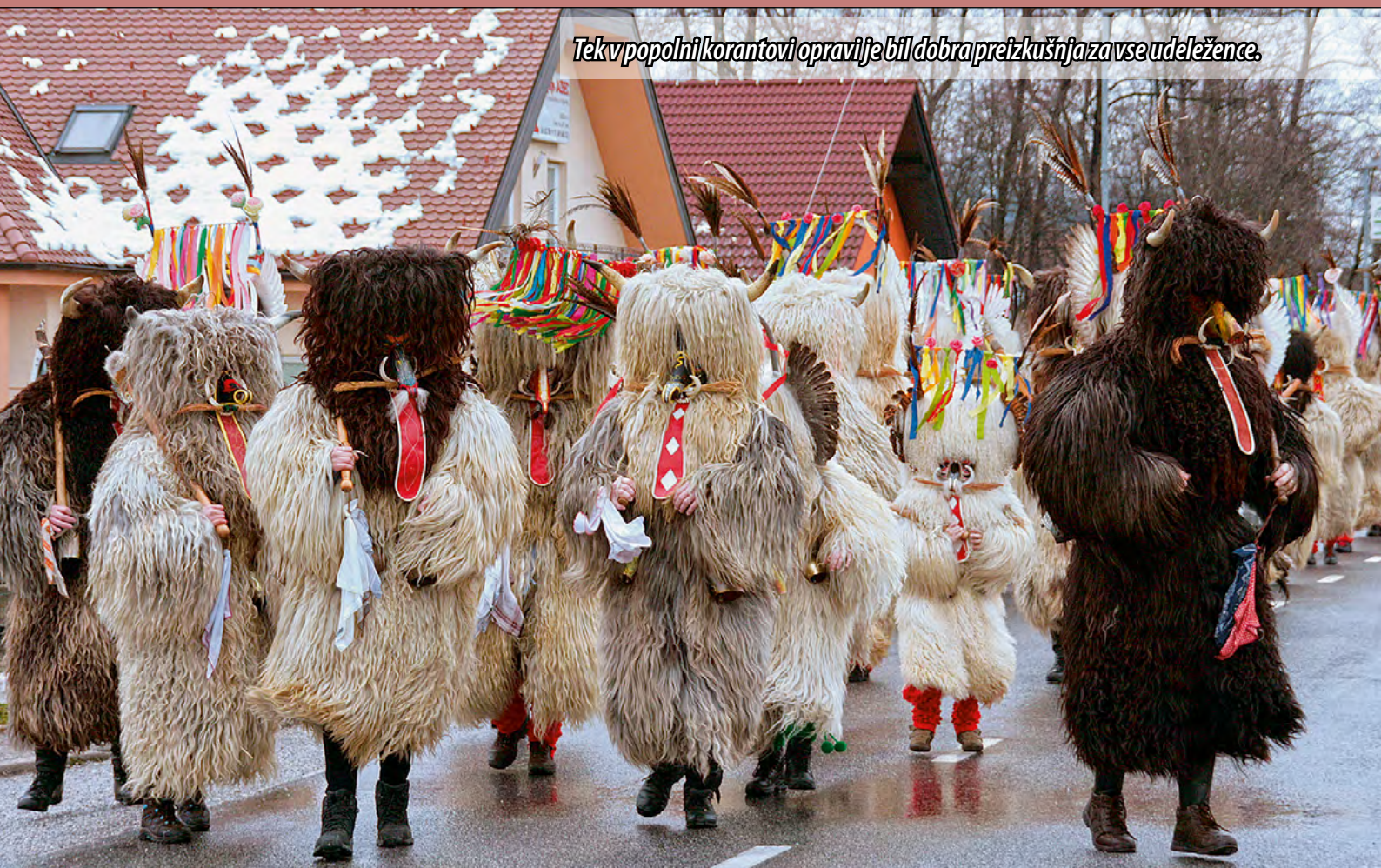
Tek v popolni korantovi opravi je bil dobra preizkušnja za vse udeležence.