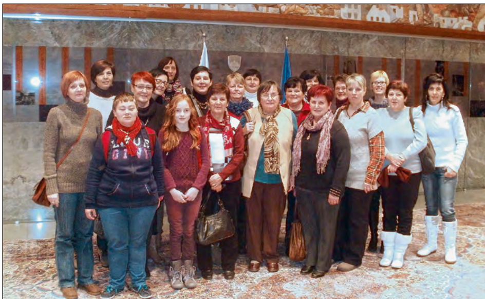
Spominska fotografija iz avle naše parlamentarne palače, december 2013

Popoldan so izletnice izkoristile za potep po mestu, za okrepčilo s toplim obrokom in za obisk stojnic z zelo raznovrstno ponudbo, vse od nogavic, pečenih kostanjev do »kuhančka«, ter za občudovanje milijonskega števila lučk, s katerimi je bilo okrašeno me-