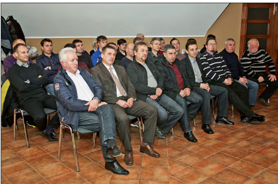
Pogled med izbrane goste, ki so si z veseljem pogledali tudi športno-zabavne utrinke ONŠ v minulem letu.