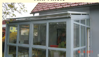
Tenda za zimske vrtove