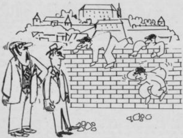
Najbrž bodo spet delili številke za plin.