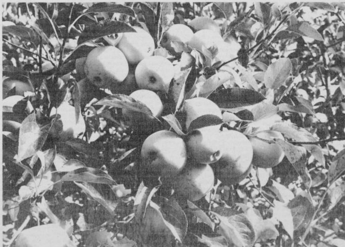
Rdeča, bela in rumena ... jabolka zore.