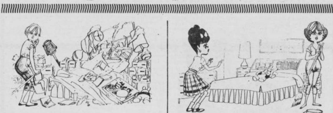
Pred sobotno akcijo NNNP ...

od 20. 2. do 20. 3. ZENSKA: Obiščite svoje prijateljice, pričakujejo vas. Imate imenitno zamisel, izpeljite jo do konca. Dobili boste dolgo pismo z ljubečo vsebino. MOŠKI: Nevihtno boste preprečili z vedrim nasmehom. Znaite oprostati? Ne pretiravajte o svojem trpljenju, zapadli boste v depresijo. Z nekom, ki niste imeli stikov že več let, se boste srečali in prijetno pokramljali. Denar.