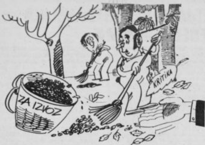
Pred leti smo uvažali tudi slamo in pesek, zakaj ne bi sedaj poskusili izvoziti še mi nekaj kakovostnega suhega listja?