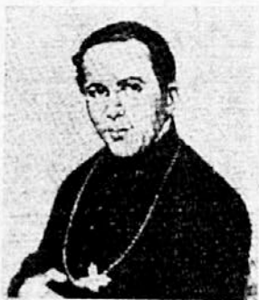
Janez Nepomuk Neumann

V ISTEM ČASU ŽIVELI — blizu skupaj umrli, skoraj obenem svetniško zasloveli — vsi trije škofje — pa jim pota do oltarja ne tečejo vstric. Kako to?