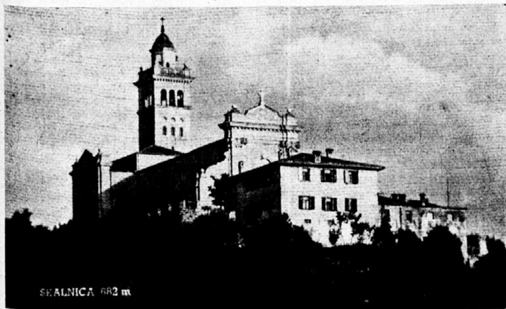
SKALNICA 682 m

Hodi, hodi — ozka, mehka avenija naj te nese, hodi srečno, brat, hodi mirno v popolnost!