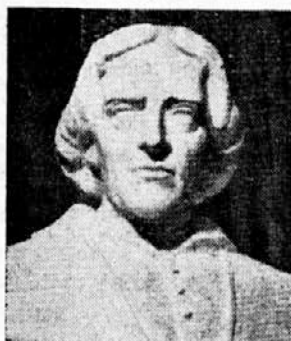
Friderik Irneej Baraga