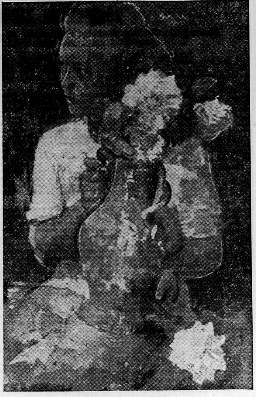
G. A. Kos: Dekle z vazo

Zaenkrat je še glavni problem ljudsko-prosvetnega dela med hrvaškimi ljudstvom analfabetizem, proti kateremu pa je prosvetna oblast mobilizirala vse razpoložljive sile, tako s strani oblastnih forumov, ministrstva in ljudskih odborov, kakor tudi s strani vseh množičnih organizacij. Boj proti nepismenosti so vključili v petletko, ob koncu katere bo nepismenost med hrvaškimi ljudstvom praktično odpravljena. Do konca petletke bodo naučili brati in pisati vse odraslo prebivalstvo do meje starosti, pa tudi vse tiste etare ljudi, ki so vključeni v industrijsko proizvodnjo. Z ozirom na stanje nepismenosti v posameznih okrajih so razdelili okraje v