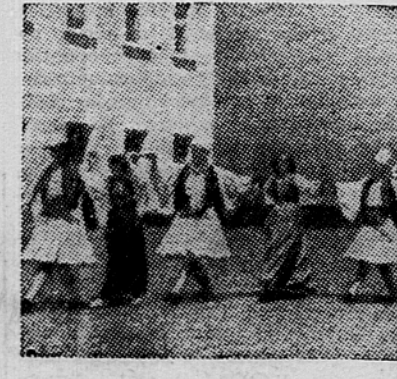
Narodni ples v južni Albaniji

to je 95% predvidenega plana. V pedagoške šole je hodilo 567 učencev, kar pomeni 98% predvidenega plana.