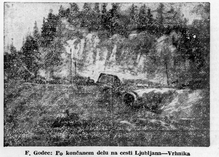
F. Godec: Po končanem delu na cesti Ljubljana—Vrhnika

Obe knjigi se lepo dopolnjujeta po snovi.