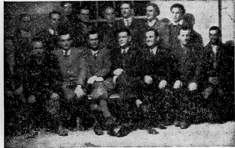
Skupina udarnikov, ki so se najbolj odlikovali pri gradnji gorenjskega daljnovega in v veliki meri pripomogli s svojimi napori, da je bil daljnovod predčasno dograjen

Kmečke ženske goriškega okraja izkorščajo dolge zimске večere za izobrazbo in politično vzgojo, organizirajo posvetovalnice in razne tečaje. Doslej imajo materinske in dečje posvetovalnice v Ajdovščini in Sempasu, ustanovljene pa bodo tudi v Solkanu in Vipavi. V Kanalu imajo tedenska strokovna predavanja o gospodinjstvu in načrtnem gospodarstvu, dočim imajo v Desklah prikorjevski tečaj, katerega se udeležuje 20 žena.