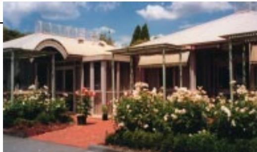
MOTHER ROMANA HOME Slovenian Hostel for the Aged Phone: 03 9853 1054 Fax: 03 9855 0811

Dom počitka matere Romane je slovenska ustanova, ki nudi bivanje v domačem okolju ostarelim in vsem, ki potrebujejo nego. Prijazna in topla soba, domača hrana, vesela družba, popolna zdravniška nega in celotna oskrba je samo del tega, kar boste našli v domu počitka le 20 metrov od slovenske cerkve v Kew.