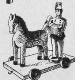
Sl. 3. Razvojne stopnje izdelave konjička (Dobrépolje); spodaj konjiček s soldatom iz Zagorice v Dobrépoljah (risal Tone Ljubič)